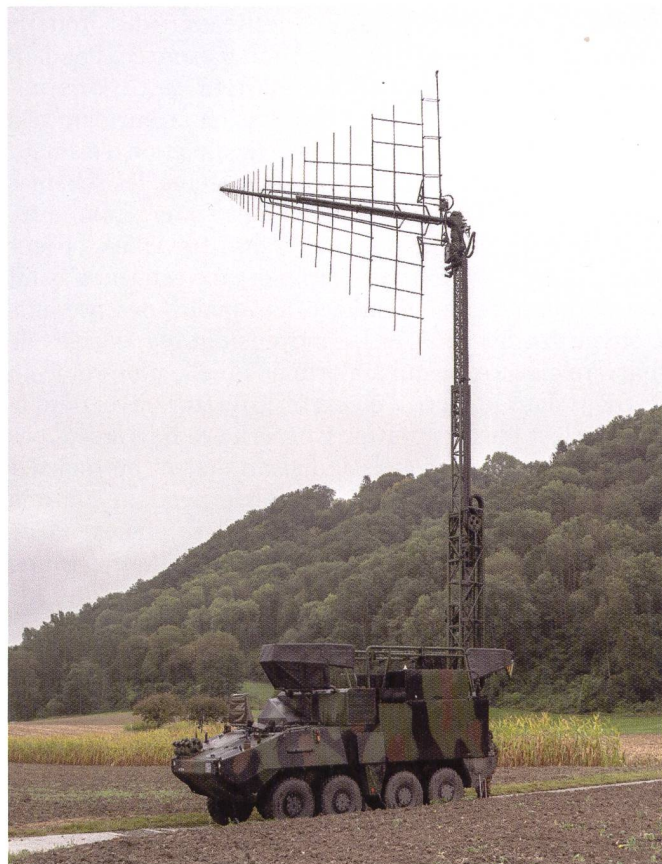
Ci-dessous : char MZS.

sur deux secteurs différents. Le dispositif a d'abord été déployé en Valais, puis démonté et déployé une nouvelle fois sur le canton de Vaud avant le démontage final. À tous les échelons, la pression s'est fait sentir : double planification, organisation de tours de gardes sur une durée plus conséquente, plus longue autonomie sur les emplacements extérieurs, gestion du temps de repos des chauffeurs, rythme de conduite intense. Ces différents challenges ont été relevés haut la main ! De plus, la situation sanitaire a imposé un cadre logistique plus contraignant puisqu'il a fallu jongler avec plus de PC arr qu'en situation normale.