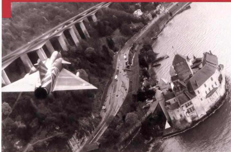
Survol du château, du fort et du viaduc de Chillon par un avion supersonique et très « photogénique » – le Mirage III RS .