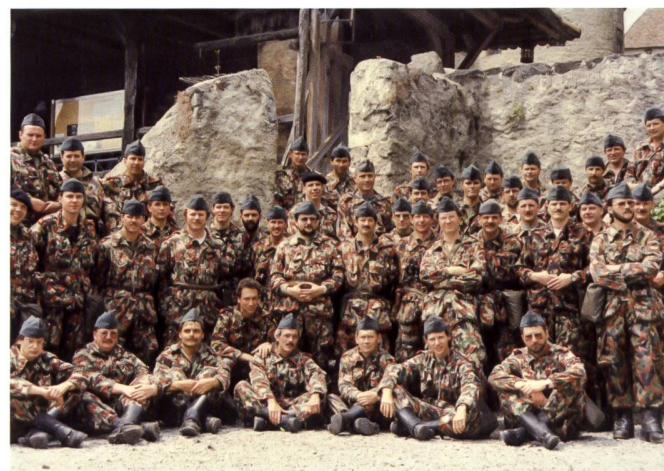
Photo de groupe du dernier cours de répétition en 1994.