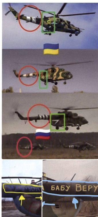
Marquages d'identification des hélicoptères russes et ukrainiens.

Quant à l'Inde, avec son milliard et demi d'habitants et qui ne dispose même pas d'un siège permanent au Conseil de sécurité alors que la France et la Grande-Bretagne en ont deux avec dix fois moins de citoyens, elle ne peut se résoudre à se laisser marginaliser par une victoire totale de l'Occident. Le non-alignement est une affaire d'honneur et de survie géopolitique pour elle.