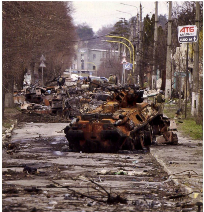
Deux illustrations d'une rue du quartier de Buchta, au nord de Kiev, avant l'arrivée des journalistes et... au moment de l'arrivée de ceux-ci.

Certains attribuent le fait que la Russie n'ait lancé son invasion que relativement tardivement, à la suite de ces révélations mettant en garde contre une invasion possible imminente. Il en a été de même en ce qui a concerné les revers militaires russes initiaux attribué en partie à ces révélations.