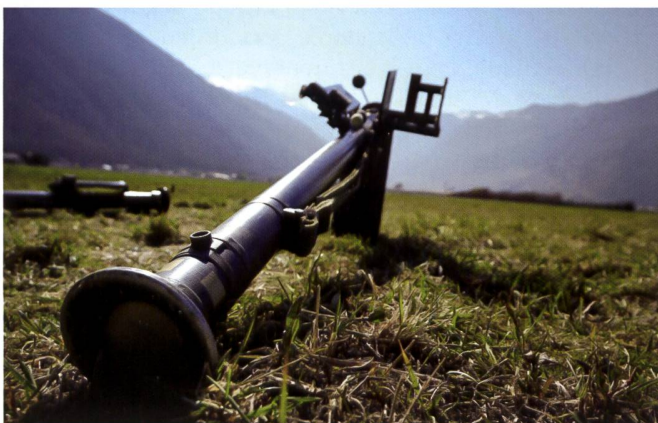
Dans le Soleil valaisan, un Stinger monte la garde.