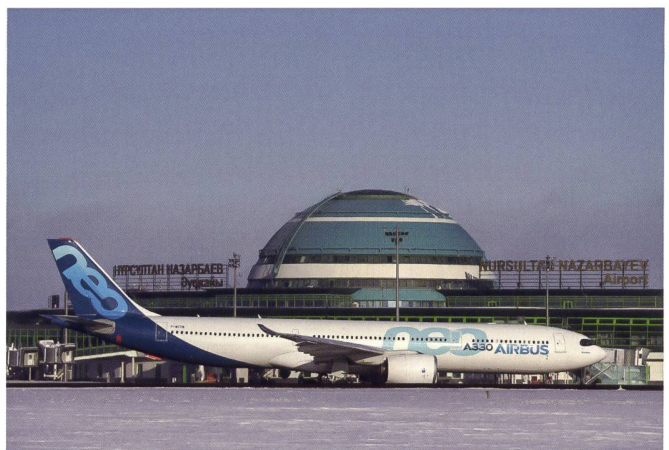
Toutes les illustrations de cette page © Airbus.