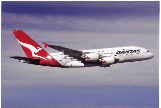
Toutes les illustrations de cette page © Skyward, DSM.