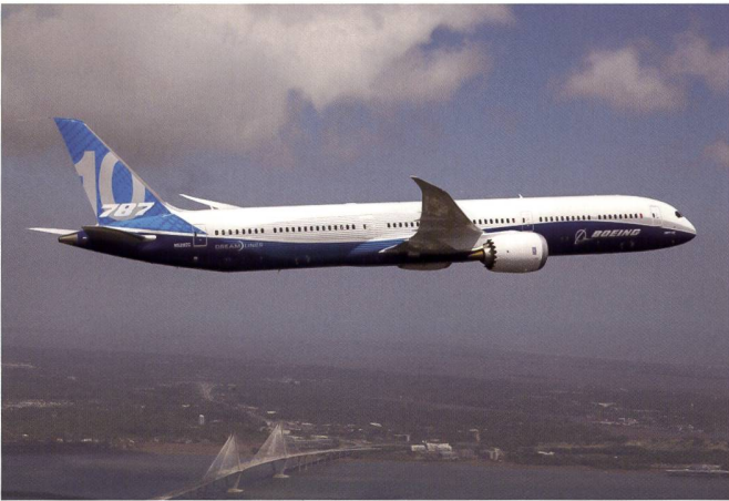
Toutes les illustrations de cette page © Boeing.