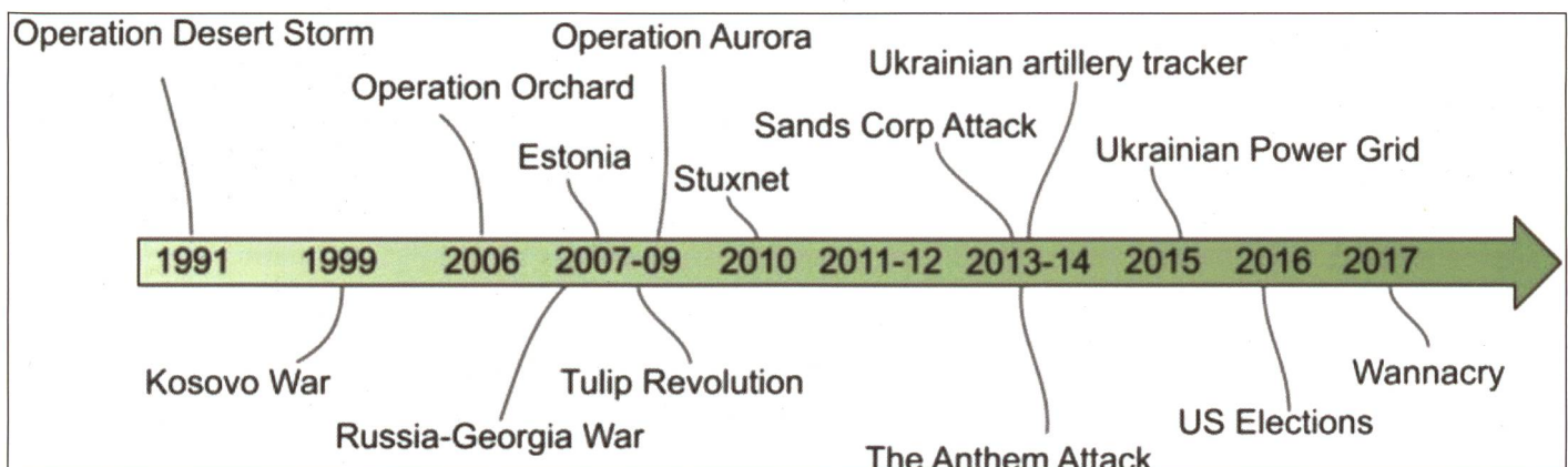
Figure 2: Représentation d'événements importants pouvant être compris dans le contexte des cyberguerres.

La Russie poursuit en revanche un développement asymétrique des capacités dans la sphère d'opération cyber. Après la dissolution des services secrets soviétiques (KGB), quatre organisations ont été créées. Le FSO pour la protection du président, le FSB comme service de renseignement intérieur et le SWR comme service