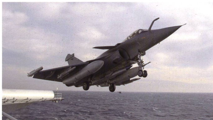
Ci-dessus : Le porte-avions à propulsion nucléaire (PAN) est un moyen permettant d'allonger la portée de la frappe stratégique.

du processus de modernisation, de mise en œuvre opérationnelle des forces et le renouvellement des systèmes. Ainsi, en 2018 pour la première fois depuis près de 20 ans, la barre des 4 Mds € était franchi et atteint en 2021 le niveau de 5 Mds €. Un chiffre qui dès 2023 atteindra 6 Mds € ; un montant annuel qui devrait être celui de ces 15 prochaines années 13 pour pouvoir réaliser l'ensemble des opérations.