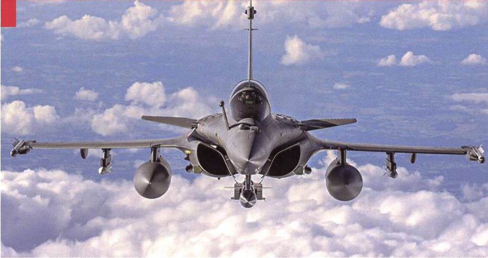
Le Rafale (ci-contre) est en train de reprendre la mission de frappe stratégique remplie depuis le milieu des années 1990 par le Mirage 2000 N (ci-dessous).