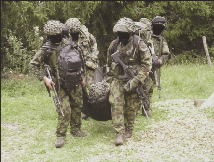
Quelques illustrations des activités de l'Association suisse des sous-officiers en Valais.