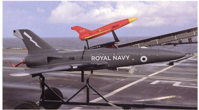
Lors de sa campagne d'essais, le Prince of Wales a mené plusieurs essais de lancement et d'opération de drones Banshee .

• 617 Squadron: La conversion des pilotes depuis le Tornado GR.4 a débuté en 2016. La formation a eu lieu à partir de décembre 2017 sur la base américaine de l'USMC à Beaufort, dans le sud de la Californie. L'escadrille a été reformée officiellement le 18 avril 2018. Les quatre premiers appareils ont traversé l'Atlantique pour atterrir en Angleterre le 6 juin 2018. Le 3 août, cinq appareils supplémentaires les ont rejoints. L'escadrille a été déclarée prête au combat le 10.01.2019. Le premier déploiement a eu lieu avec six appareils à RAF Akrotiri sur l'île de Chypre (22.05.2019). Le 16 juin, l'escadrille a mené plusieurs sorties de combat au-dessus de la Syrie. Le 9.10.2019, trois appareils ont quitté les USA pour embarquer sur le porte-avions HMS Queen Elizabeth , aux côtés des trois appareils du No. 17 TES arrivés le 13.10. Le