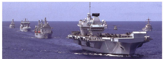
Le navire amiral de la flotte britannique ne se déplace pas sans escorte de surface et sous-marine, et sans ses ravitailleurs.

Le pont d'envol est spacieux. Le code « Q » désigne le nom du bâtiment.