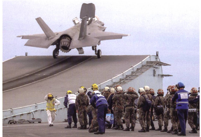
Moment impressionnant du décollage d'un F-35B sur le ski-jump de HMS Queen Elizabeth .

Les deux nouveaux porte-avions sont trois fois plus grand que les porte-aéronefs de la classe Invincible qu'ils remplacent. Ils peuvent également emporter trois fois plus d'appareils à leur bord – jusqu'à 72, contre 22 pour l' Invincible . Le groupe aérien devrait comporter en principe 24 à 36 F-35B et entre 4 et 14 hélicoptères. Malgré cela, l'équipage est moins nombreux que sur les anciens bâtiments : 679 contre 726 et 384 pour le groupe aérien de la classe Invincible . Malgré cela, la nouvelle classe peut emporter 250 soldats supplémentaires, destinés à être hélicoptérés ou débarqués pour des missions à terre. Et il est possible d'embarquer au total, si nécessaire, jusqu'à 1'600 personnes.