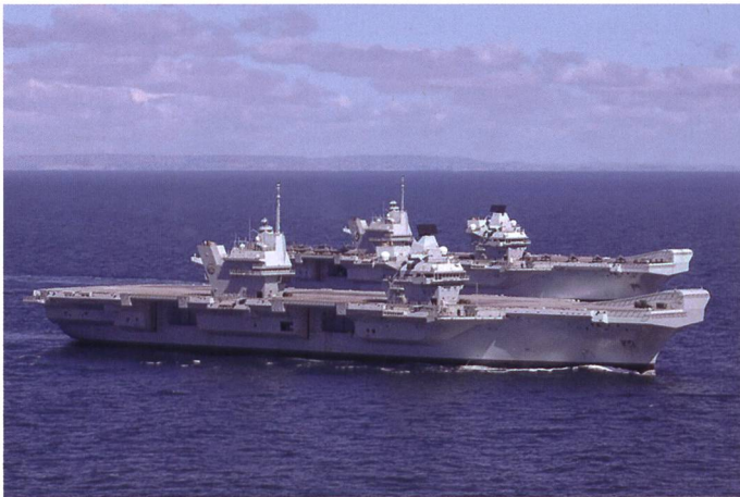
Les deux porte-avions lors d'un entraînement conjoint. On constate que le bâtiment plus récent ne dispose pas encore de son groupe aérien embarqué.