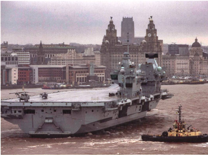
Durant ses essais à la mer, HMS Prince of Wales a fait une escale d'une semaine à Liverpool, sa ville marraine.