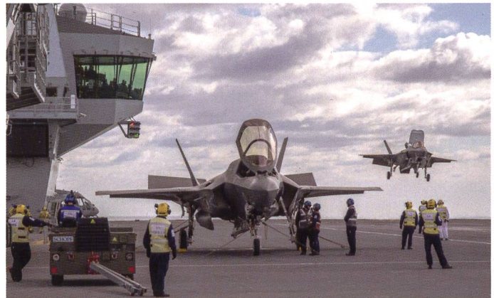
Les appareils appontent. Le kiosque arrière du navire est principalement dédié aux opérations de vol, alors que l'avant sert prioritairement à la navigation.