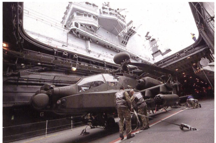
Le hangar est spacieux et les élévateurs permettent de déplacer un AH-64 Apache (ci-dessus) ou un EH 101 Merlin (ci-dessous), ainsi qu'un CH-47 Chinook ou même l'OV-22 Osprey . Ce dernier n'est pas en service actuellement dans la Royal Navy.