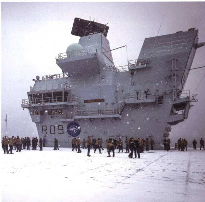
Le flagship du commandement maritime européen de l'OTAN durant l'exercice – bien nommé – COLD RESPONSE.

Singapour et de conduire en Mer de Chine des exercices avec l'US Navy. Une visite en Corée et des exercices proches du Japon avec les forces américaines et japonaises ont également eu lieu.