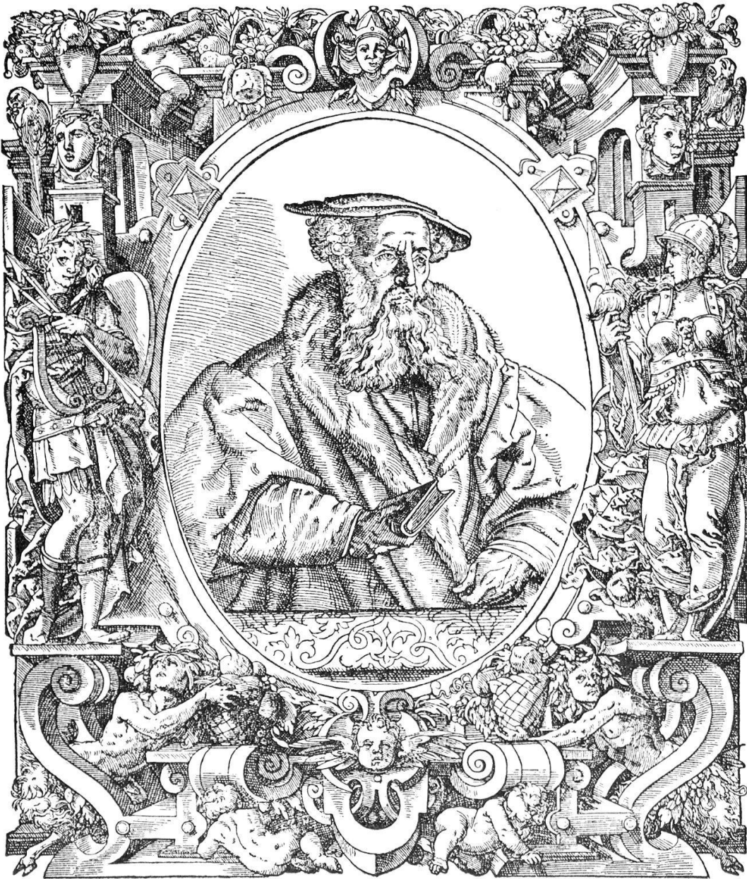
Fig. 1. Portrait du réformateur Henri Bullinger de Zurich. Gravure sur bois par Bernard Jobin à Strasbourg, 1571.

Bullingers/ Dieners der Kirchen zu Zürich.