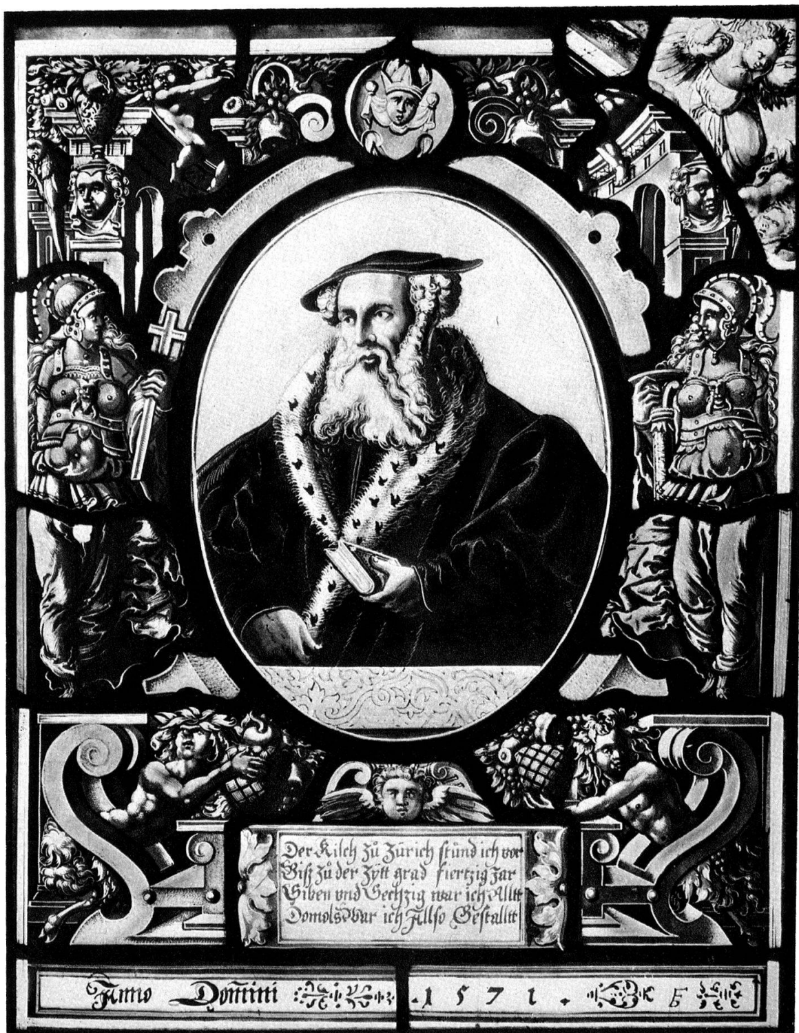
Vitrail avec portrait d'Henri Bullinger de Zurich, 1571.