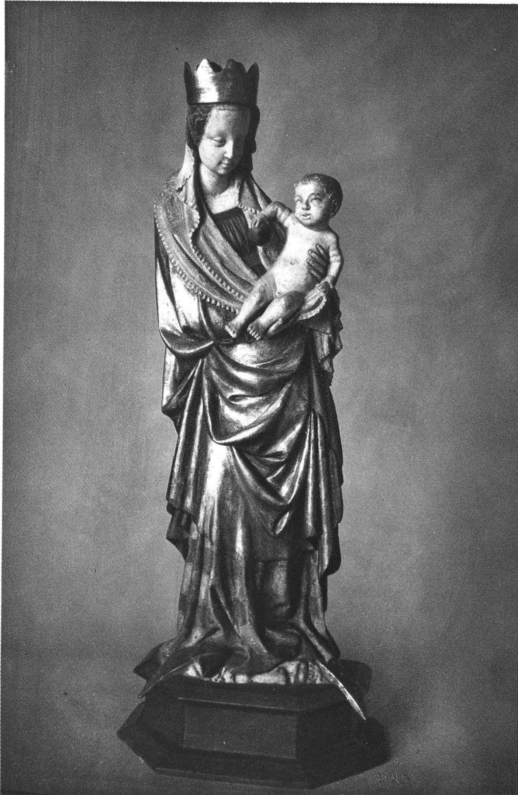
Madonna aus dem Baldachin=Altar von Leiggenen (Kt. Wallis).