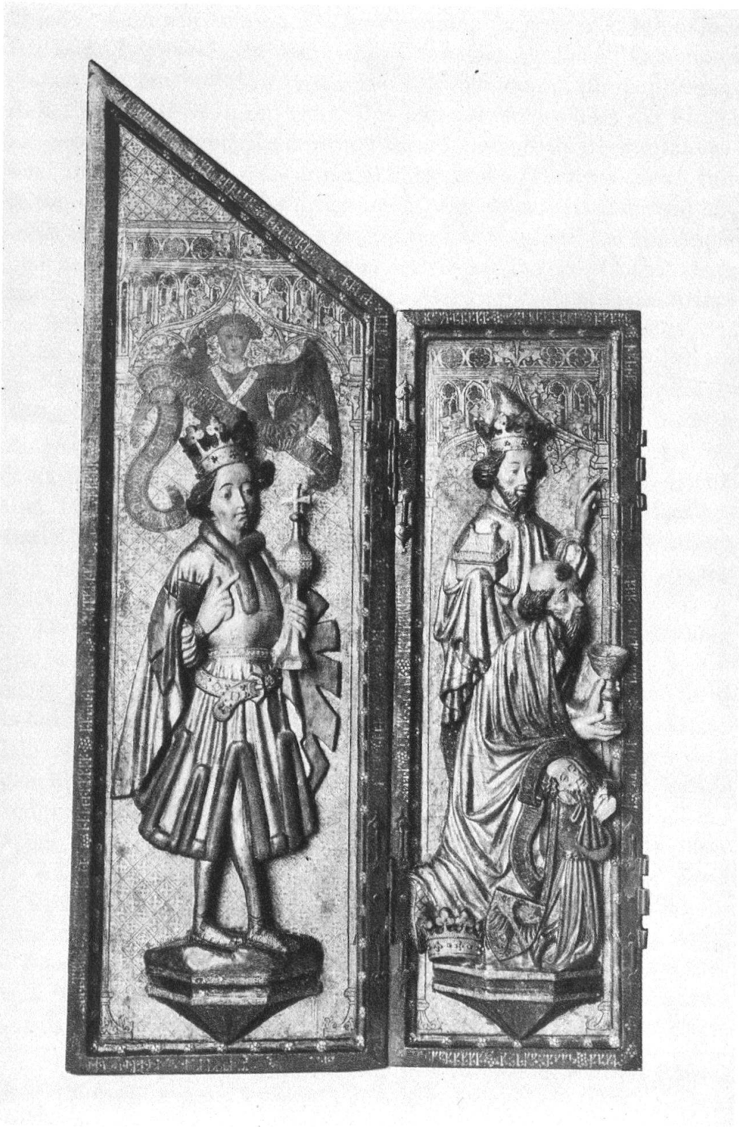
Altar aus Leiggenen. Linker Flügel mit Anbetung der hl. drei Könige und dem Stifter.