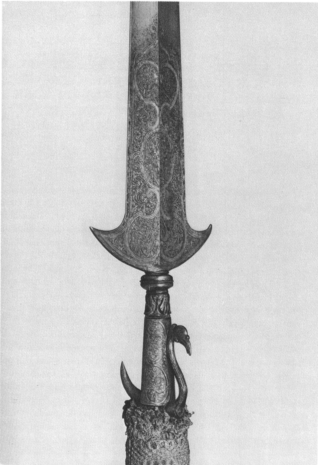
Offizierspartisane mit geätzter und vergoldeter Klinge. 17. Jahrhundert.