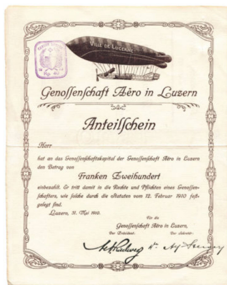
13 Part sociale de 200 francs de la coopérative Aero de Lucerne, 1910.