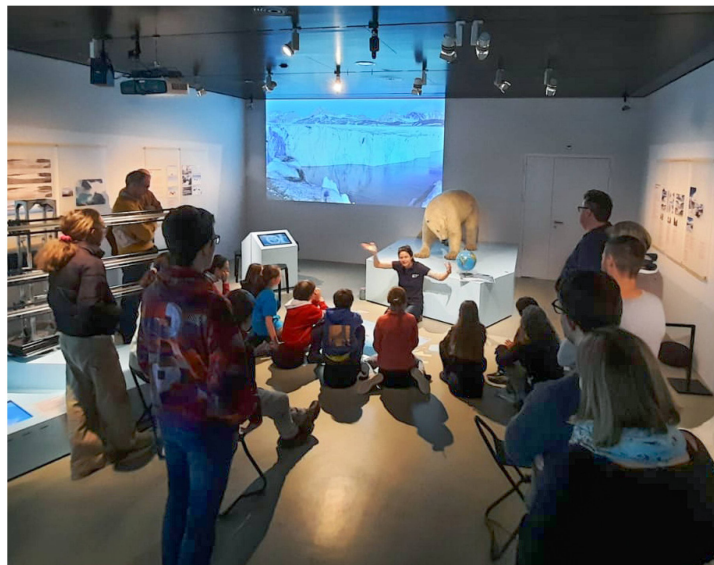
Atelier dans l'exposition «Le Groenland en 1912»

Douze ans après son lancement, l'exposition permanente «Les origines de la Suisse» reste très appréciée des groupes scolaires. Durant l'année sous revue, «History Run Schwyz» a également été le programme le plus réservé par les enseignant-e-s. Au total, 87 classes ont visité le Forum de l'histoire suisse Schwytz: 52 en combinaison avec le programme «History Run Schwyz», et 24 avec une visite guidée de l'exposition permanente. Comparativement à l'année précédente, les groupes d'adultes ont réservé davantage de visites guidées; les visites de l'exposition destinées aux familles ont également connu une belle fréquentation.