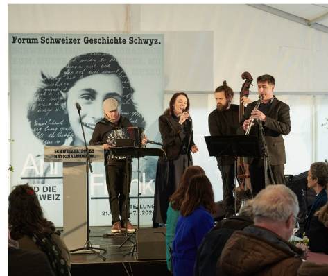
L'ensemble BENDORIM a joué à l'occasion du vernissage «Anne Frank et la Suisse».

Les grandes manifestations culturelles du Forum de l'histoire suisse Schwytz se sont achevées avec la Nuit du shopping dans une mer de lumière (Einkaufsnacht im Lichtermeer) le 3 décembre. Malgré une pluie battante, de nombreuses personnes sont venues au Forum où les attendaient nos médiatrices et médiateurs culturels avec quelques visites guidées dans un format court.