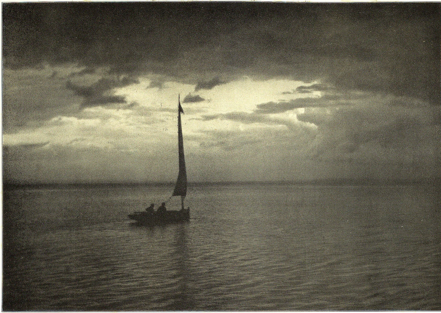
Abendstimmung am Bodensee.