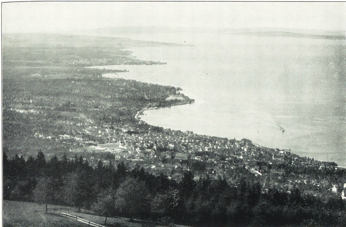
RORSCHACH und ARBON vom Rorschacherberg aus.