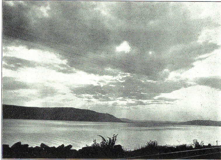
Sonnenuntergang bei Ueberlingen.

Und Lisa blieb an jedem Kinderwagen, in dem ein weibliches Jahrkindchen lag, stehen und rief begeistert: „Nein, wie allerliebste, dies entzückende Mützchen und die schönen Guckaugen! Ich bleib dabei, nur so'n süßes, kleines Mädel darf's sein!“