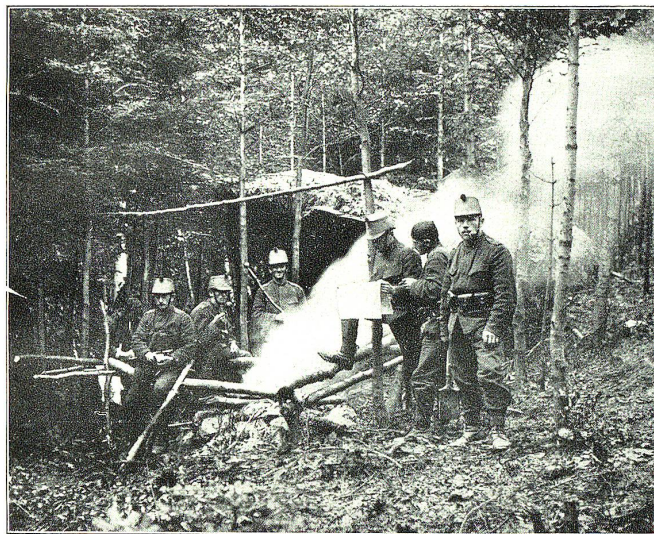
Grenzbesetzung 1914: An der franz.-schweizer. Grenze.

Da sagte plötzlich die helle Stimme des jungen Thüringers: „Heute ist Weihnachten!“ — Wir starrten ihn an. Einer nach dem andern begann zu rechnen, wann wir abgeritten, wieviele Tage seitdem vergangen. Unser