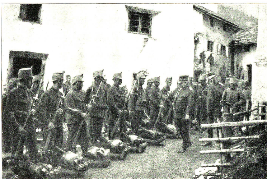
Schweiz. Grenzbesetzung: Inspektion der Wache durch General Wille.

Ich schreibe dir nicht in sehr salonfähiger Toilette, denn ich „sonnenbade“. Der gesegnete Wachtbefehl wurde gerade vor der Mittagspause erteilt und da bin ich denn knurrend zu meinem täglichen Verdauungssonnenbad, am sonnigen Abhang oberhalb der Ortschaft, heraufgestiegen. — — Da unten liegt sie, diese Perle von einem Bahnhof, in ihrer ganzen