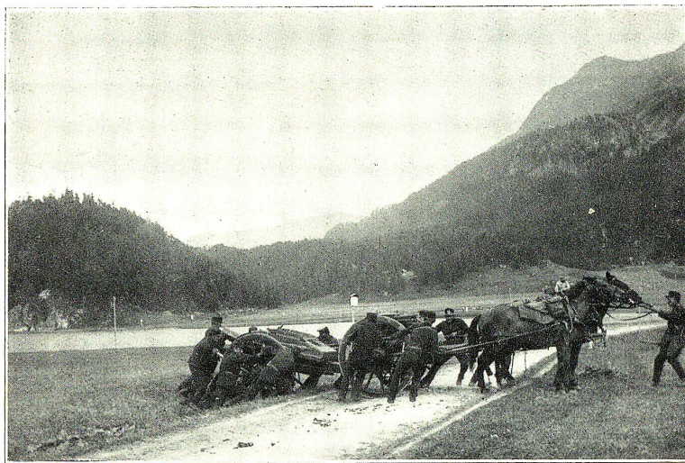
Schweiz. Grenzbesetzung: Mörser geht aus Feuerstellung.

Das Idyll der Ruhe und des geistesabwesenden Versunkenseins in nichts fand ein jähes Ende, als mein Wachmeister mit einigen Soldaten ins Tenntrat. — Die Fusiliere verhängen mit ihren Käppis den Ausblick