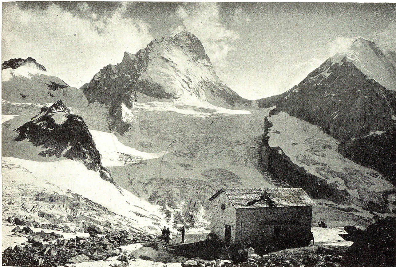
Mountet-Hütte, Dent Blanche und Grand Cornier.

Ein altes deutsches Sprichwort sagt: „Der Neutrale wird von unten gefengt und von oben begossen.“ Das in den Haager Konventionen niedergelegte Völkerrecht sieht vor, daß bei einem Kriege im allgemeinen der Handel der Neutralen frei bleiben soll. Sogar Waffen und Munition können von Neutralen an Kriegführende geliefert werden. Allerdings haben die Kriegführenden das Recht,