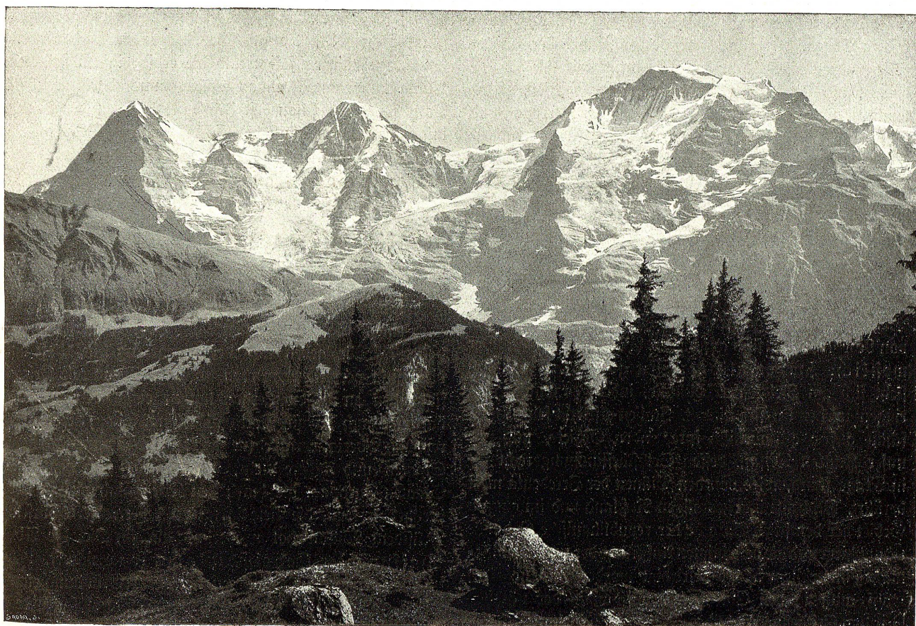
Eiger, Mönch und Jungfrau.

Wer hätte in den unheilswangeren Tagen Ende Juli und Anfang August 1914 voraussehen können, daß