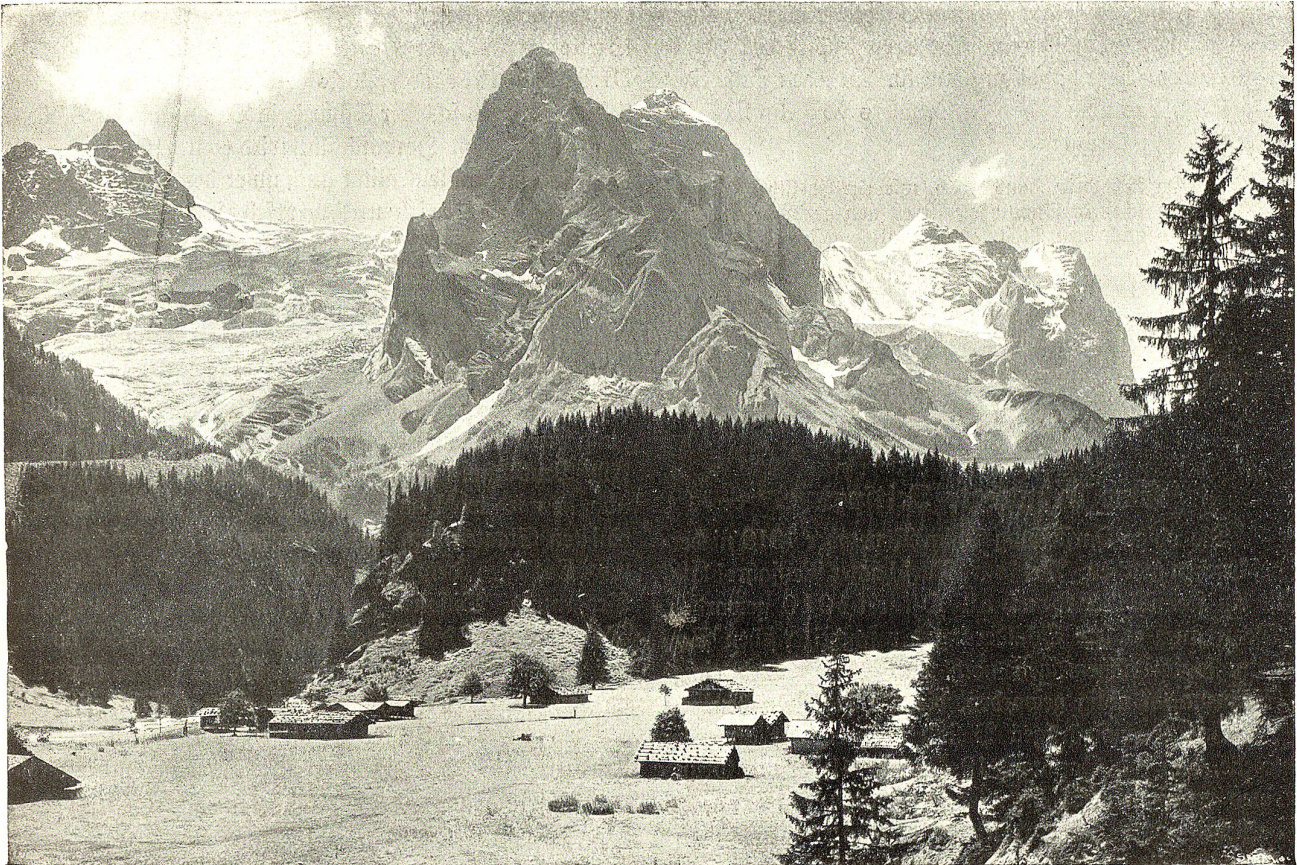
Rosenlaui, Wellhorn und Wetterhorn.

Auf internationalem Gebiet ist es unsere Pflicht, bei