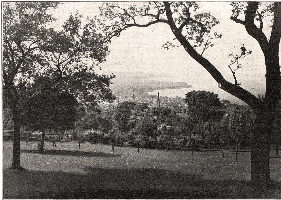
Rorschacherberg: Blick auf Rorschach.