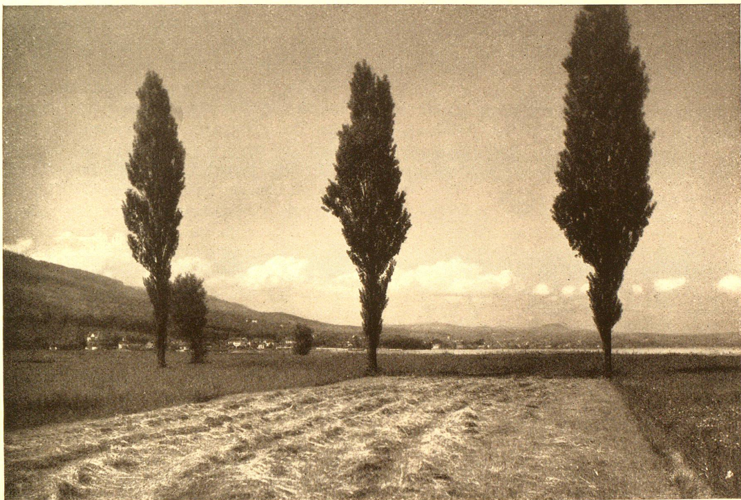
Blick auf Rorschach

stimmung, die den Bergwanderer umschliesst; darum dieser Drang nach der Höhe. Darum ziehen so viele in den Tagen der Rosen von dannen, einen guten Freund oder die Leibesnächsten zur Seite und wandern den schwätzigten Bergwassern entlang, hinauf in die einsame Gottesnatur, um auf