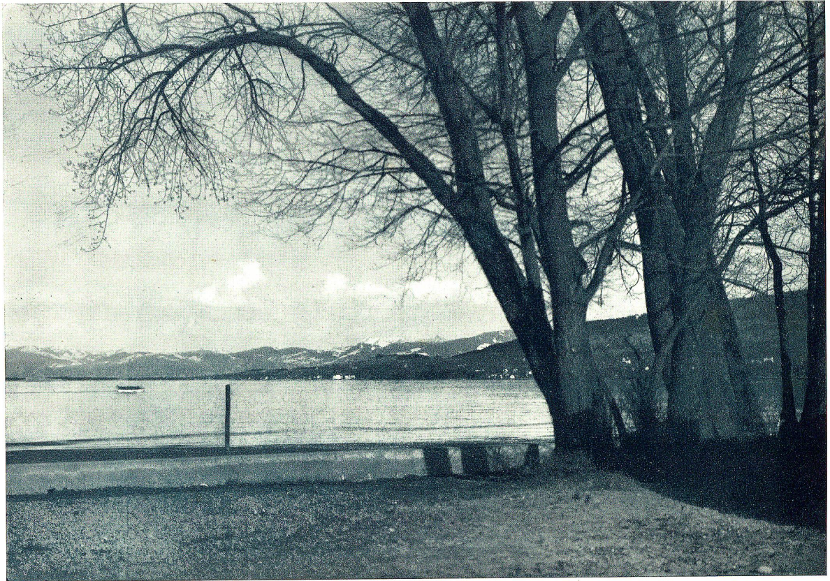
Blick auf Rorschach vom «Rietli» aus.