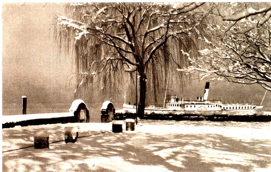
Winter 1931 in Rorschach.

Ueber die Scholle, an der wir so hangen, sind viel liebe Menschen gegangen, haben geackert und gesät, haben gelbes Korn gemäht. Satt und gebeugt ist mancher geschritten. Mancher hat heimlich Sehnsucht gelitten. Fragende Augen blickten stumm Nach geahnten Wundern sich um. Stammerlippen regten sich leise — Ungesungen blieb die Weise, sank wie fernes Glockengeläut in des Alltags Not und Streit. Dankend möcht ich die Hand euch geben, allen, die auch ein hartes Leben nicht zu stumpfen Knechten gemacht! Ihr gabt dem Acker heimliche Macht. Eure Lieder, die nie befreiten, geistern über den Felderbreiten, und der Müdling, bedrückt und froh, Lauscht versonnen, was klingt denn so?»