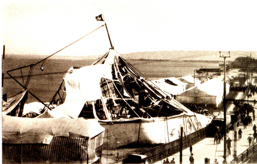
Zirkus Knie im Sturme vom 5. April 1932.

Launig, unstät begann der April. Sein bösesartiges Treiben erreichte den Höhepunkt im plötzlichen Sturme vom 5. d. Mts. Mit plötzlicher, unbändiger Kraft raste er über den See hin. Auf dem Kurplatze hatte eben der Zirkus Knie seine Tier- und Vorführungszelte aufgeschlagen. Die grossen Masten, Mannesmannröhren mit 35 mm Dicke unten und 18 mm oben brachen, wie ein Stock bricht, Seile rissen, Schienen bogen sich und die grosse Zelthülle riss in Fetzen.