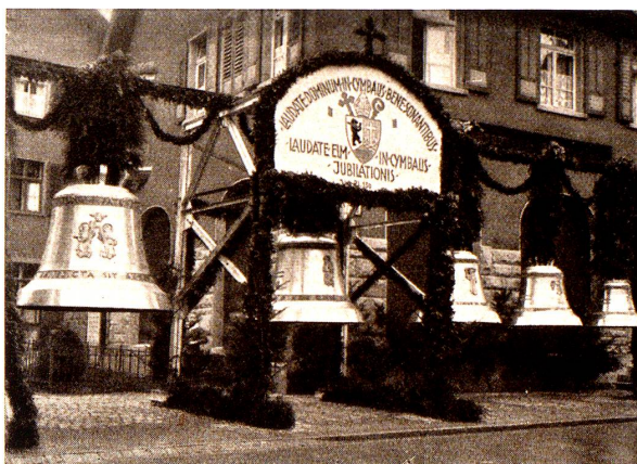
Die neuen Glocken der katholischen Kirche Rorschach.

liche Weihe erfolgte. Bereits am 2. Dezember stiegen sie, von der freudigen Kraft der Schuljugend gehoben, in ihre Stuben. Zur Mette des Weihnachtsfestes ging ihr Ruf erstmals in die tiefe Nacht hinaus, ein Friedensgeläute am Friedensfeste.