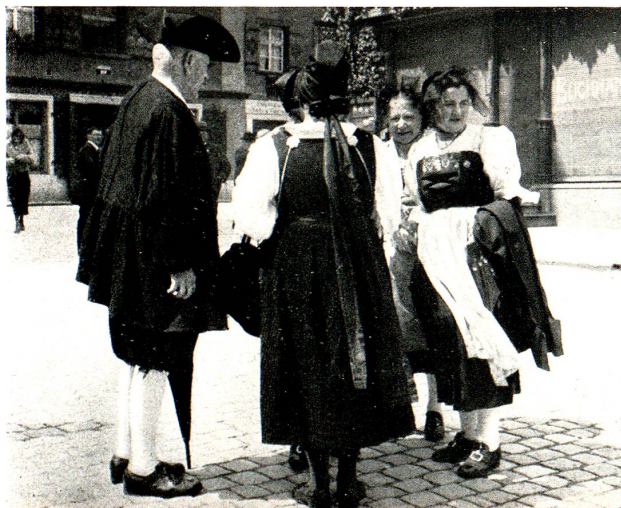
Rendez-vous der Freiämter

Den Trachtenleuten, die in Heiden einquartiert, passiert allerlei. Um 1 Uhr nachts, als im Hafengebäude oben Hochbetrieb herrscht, mahnt der Betriebschef der Heidenerbahn zum Aufbruch. Bis aber die Letzten kommen, ist der Zug schon ab. Ein Wehklagen hebt an; man erbarmt sich der Armen und kann den Zug in