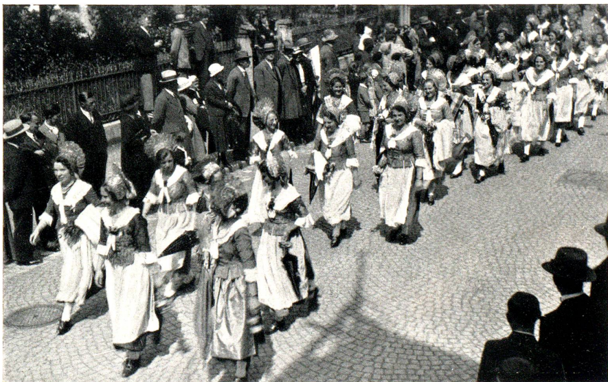
Gruppe Rorschach im Festzug

Aber dann gibts kein Halten mehr. Nur kurze Zeit bleibt bis zur Abfahrt des Extrazuges. Die muss noch gehörig ausgenützt werden, sei es beim Tanz oder einem «Schöppli Wii». Andere wieder ziehen singend ein letztes Mal durch unser Städtli, und solche gibts, die einen langen Abschied von ihren Gastgebern brauchen. — Im Nu ist es 18 Uhr. Ein letztes Liebäugeln . . . und unter Jubeln, Tüchlein- und Fahnen-schwenken fahren die frohen Trachtenleute heim.