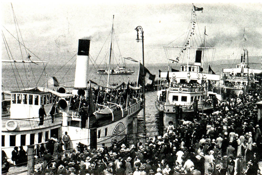
Die drei Schiffe zur Sonntagnachmittags-Fahrt bereit

Das Fest ist aus. Trotz des Regens ist die Erinnerung eine helle, freudige. Die Opferfreudigkeit vieler Rorschacher trug wesentlich bei zum guten Gelingen des denkwürdigen Tages. Das Fest hat so recht vor Augen geführt, wie viel Bodenständigkeit und Zugehörigkeit zur Heimat in unserm Volke steckt. Das Volk hat grosses Bedürfnis, dieses Bekenntnis zu feiern in einfacher, doch umso eindringlicherer Form. Freundschaft und Heimatliebe wachsen aus solchen Zusammenkünften und sie sollen auch bei uns an der äussersten Grenze des Vaterlandes immer wieder neu erblühen.