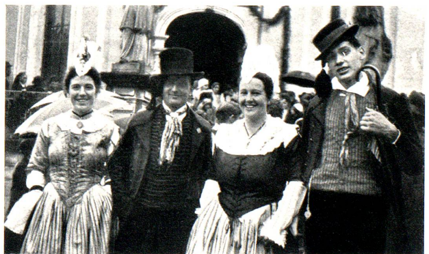
Schwyzgruppe auf dem Kirchplatz

einem der folgenden Abende die Aufführung auf Mariaberg wiederholen zu können. Aber das schlechte Wetter hielt so lange an, dass die Bühne abgebrochen werden musste. Der Ausfall der Freilichtaufführung schmerzt mich heute noch.