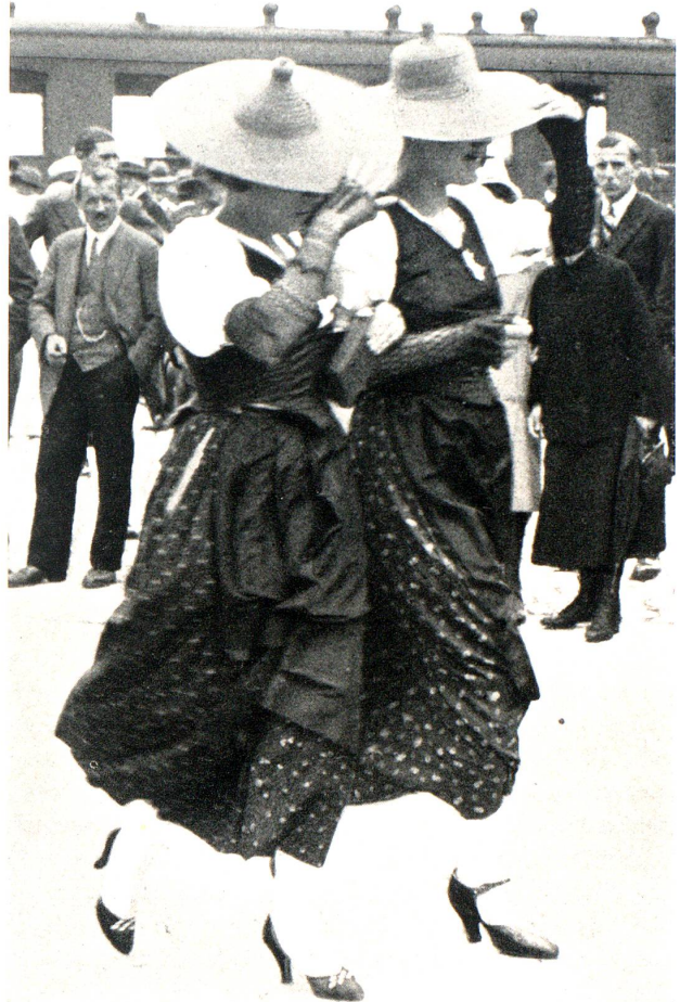
Les Belles de Montreux

Im SchäfliSaale macht Herr Dr. Eisenring den «Tätschmeister» mit viel Geschick und Humor. Auch dort gibt es allerlei Unprogrammässiges. Leider kann Rorschach als grösste Gruppe dort nicht vollzählig auftreten, — zum grossen Leidwesen vieler. Wir hofften dann, an