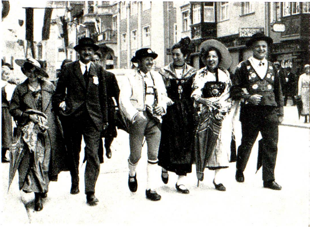
Toggenburger Senn, Bündnerin, Zugerin und Altdorfer treffen sich zum frohen Sonntagsbummel