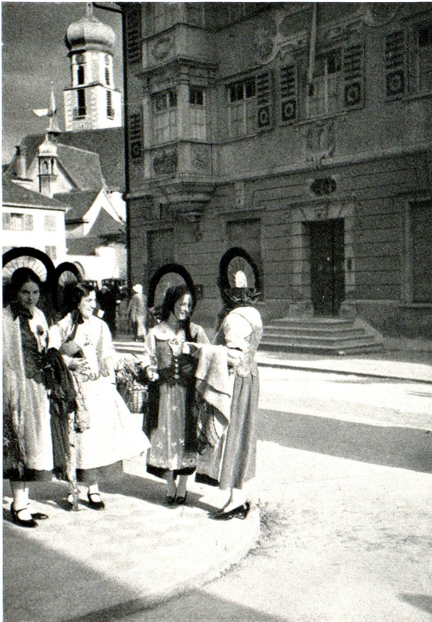
Trachtengruppe von Gossauerinnen