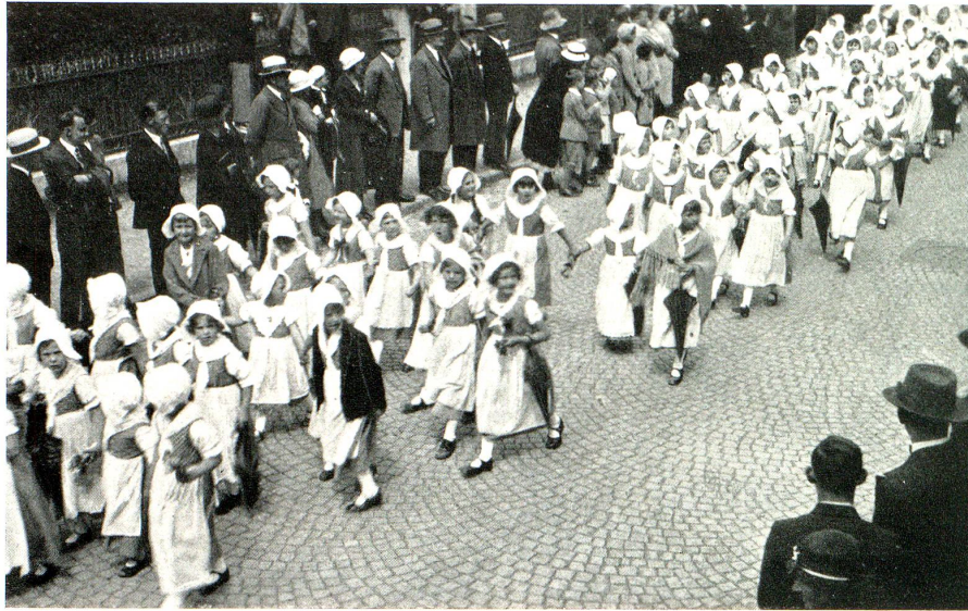
Rorschacher Jugend im Festzug