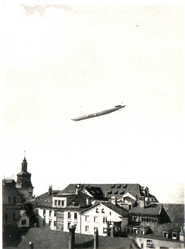
Zeppelin im Flug über Rorschach anlässlich der N.O.S.

Reiche» liessen deutsches Reisevolk zumeist auch nur bis an das deutsche Ufer kommen. Grenzübertrittsschwierigkeiten neuer und altgewohnter Art entvölkerten weiter die in den letzten Jahren schön ausgebauten Schiffe des schwäbischen Meeres für die Reisen in die Schweiz.