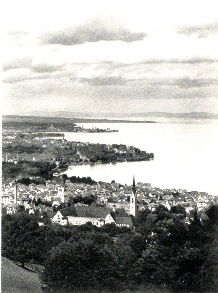
Rorschach mit den westlichen Buchten