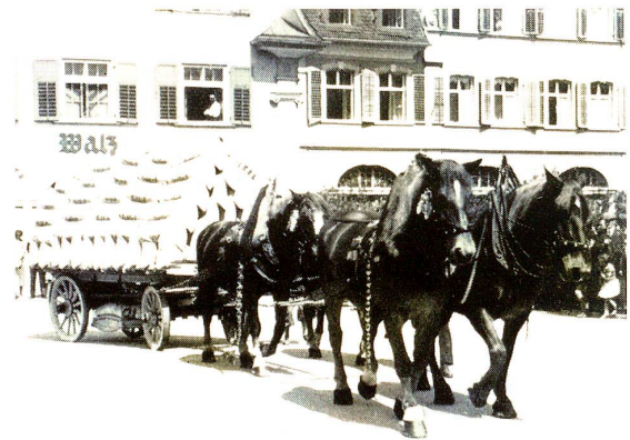
«Des Volkes Nahrung» (Bruggmühle, Goldach)

phon der eifrige «Speaker» (der nota bene als Erprobter seine Sache gut gemacht hat) durch Ansage der ersten Nennung in der leichten Kategorie — offen für Soldaten und Gefreite — die offizielle Springkonkurrenz. Im «Preis vom Marienberg» kämpften 53 Reiter um die Siegespalme. Die Piste führte über 8 Hindernisse, maximum 1 Meter hoch, maximum 2 Meter breit. Es starteten hier hauptsächlich junge Dragoner als beachtenswerter Nachwuchs, deren Pferde sich in guter Kondition befanden. Dem einen oder andern «Eidgenossen» mag vielleicht die begommene Arbeit in Wiese und Feld etwas in die Knochen geschlagen haben, oder war er von dieser «sonntäglichen Beschäftigung» nicht gerade erbaut? Einige der Konkurrenten gehörten zu den «Verbliebenen», zu jenen, die wohl immer sang- und klanglos abseits von der Strasse des Erfolges stehen werden oder nur auf gut Glück bauen. Sie verkannten dabei gar oft das «Vorwärts» in steter Verteidigung, in der Sorge um das eigene «Ich», im Kampf vor dem «Fall». — Das Pferd ist eben ein Lebewesen, das bei willensschwachen Reitern seinen eigenen Willen machtvoll durchsetzt. — Im Hinblick auf den Saisonbeginn und den Charakter dieser Soldatenserie als Einführungsspringen, waren die Leistungen recht gut. Dem Fachmann mögen da und dort wohl noch Mängel in Haltung, Sitz und Steuerung aufgefallen sein. Es ist in-