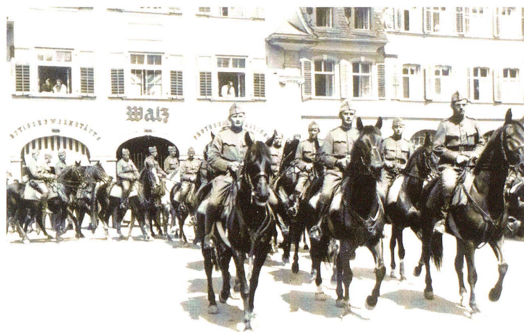
„Fest im Sattel“

zeigten die Kavalleristen unter dem Sattel ihre «feurigen Eidgenossen», durchwegs prächtiges, gepflegtes Pferdmaterial vornehmlich irischer Zucht. Das Auge konnte sich an dem von Herrn Train-Adj.Uof. Buschor