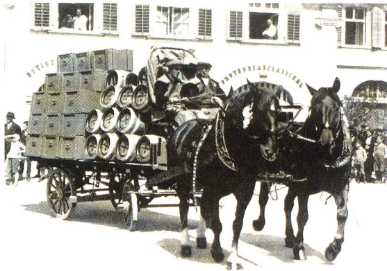
«Für den Durst» (Brauerei Löwengarten A.-G., Rorschach)

tur, und nicht mit einer Schweizer Qualitätsuhr zu vergleichen, die tagtäglich fehlerlos läuft. Qualitativ Hervorragendes ist in Rorschach im schweren Soldatenspringen geboten worden. Die Leistungen standen auf einer erfreulichen Basis. Sie vermochten allseits volle Anerkennung abzuwingen. Egnach stellte hier seine