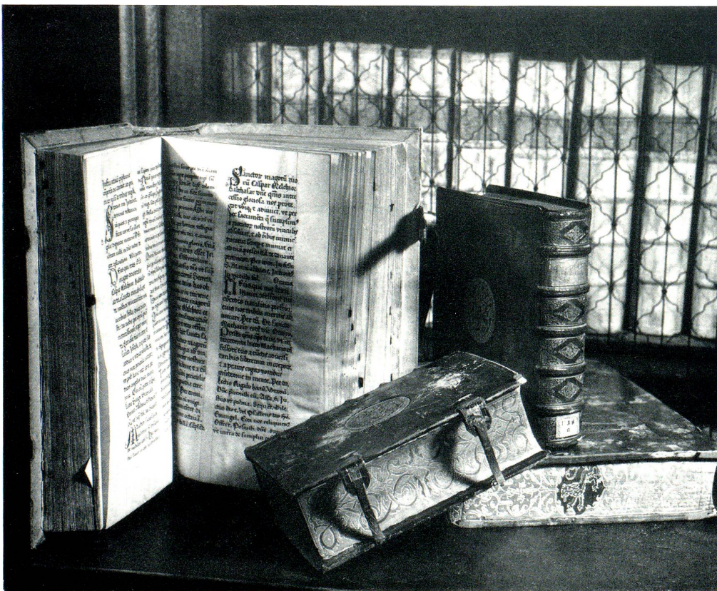
Alte, handgeschriebene Bücher in der Stiftsbibliothek des Klosters St. Gallen