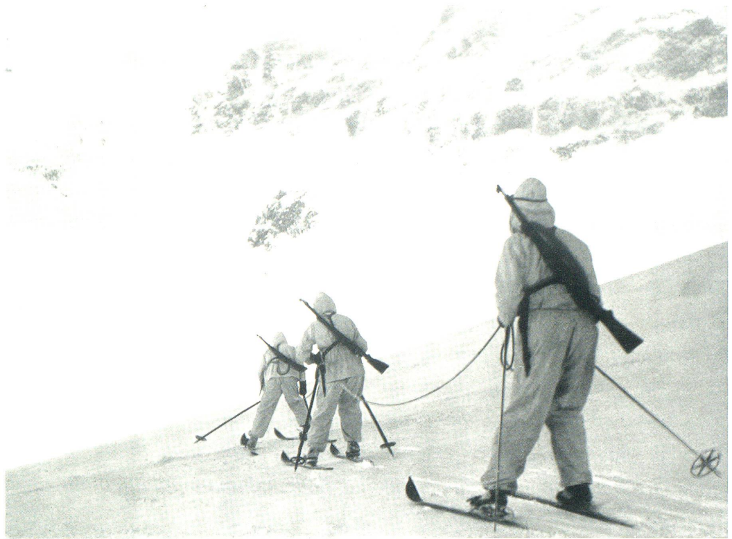
Skipatrouille im Hochgebirge