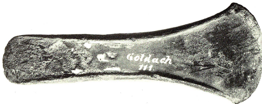
Abb. 2. Bronzebeil aus der späten Bronzezeit. Streufund aus Goldach. Historisches Museum in St. Gallen.

dortigen Besitzes dem Kloster schenkte 42 . Das Kloster mußte daher darnach trachten, durch Tausch und durch Erwerb, d. h. durch Übernahme von eigenen Verpflichtungen, seinen Besitz in unserer Gegend zu erweitern und abzurunden. Das war besonders der Fall nach 854. Der Ulmervertrag 43 hatte in diesem Jahr den beinahe hundertjährigen Streit zwischen Konstanz und St. Gallen zu Gunsten des Klosters beigelegt. Frei geworden, suchte nun das Kloster seinen Besitz in seiner Nähe, besonders gegen den Bodensee hin, planmäßig auszudehnen. Diesem Be-