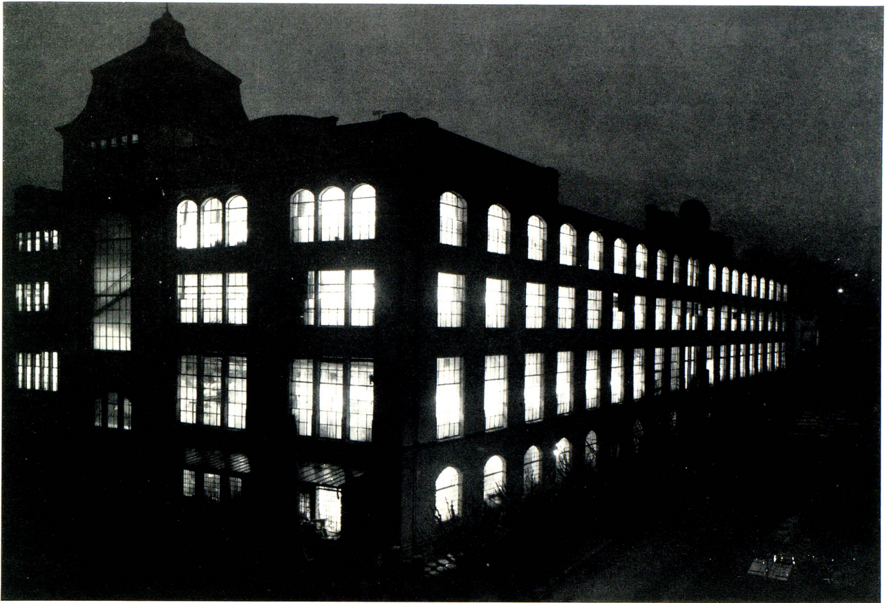
Die Feldmühle bei Nacht