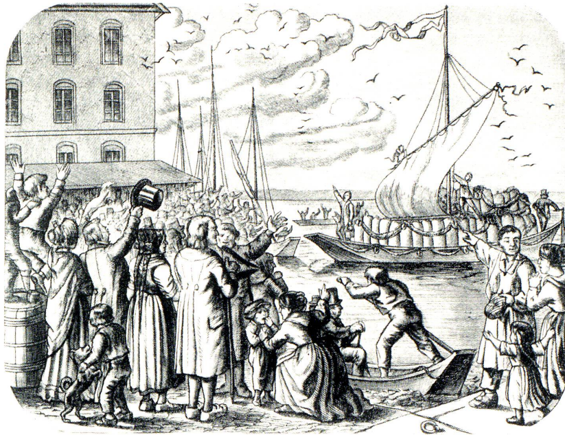
Die erste Ladung venetianischen und mailändischen Kornes trifft während der Kornsperr des Schwabenlandes um 1770 in Rorschach ein