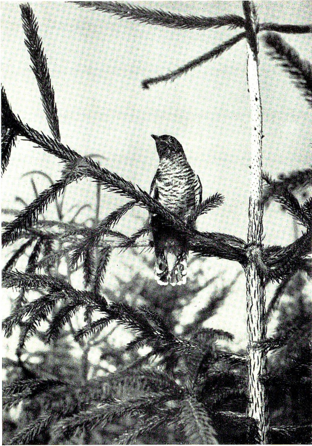
«Guggu! Guggu!» ruft's aus dem Wald.

Der gewaltige Schloßturm bietet einer Steinmarderfamilie seit undenklichen Zeiten Unterschlupf. Diese freche Bande verführt nachts gelegentlich einen Höllnlärm, als ob die Geister der einstigen Ritter des uralten Schlosses umgingen.