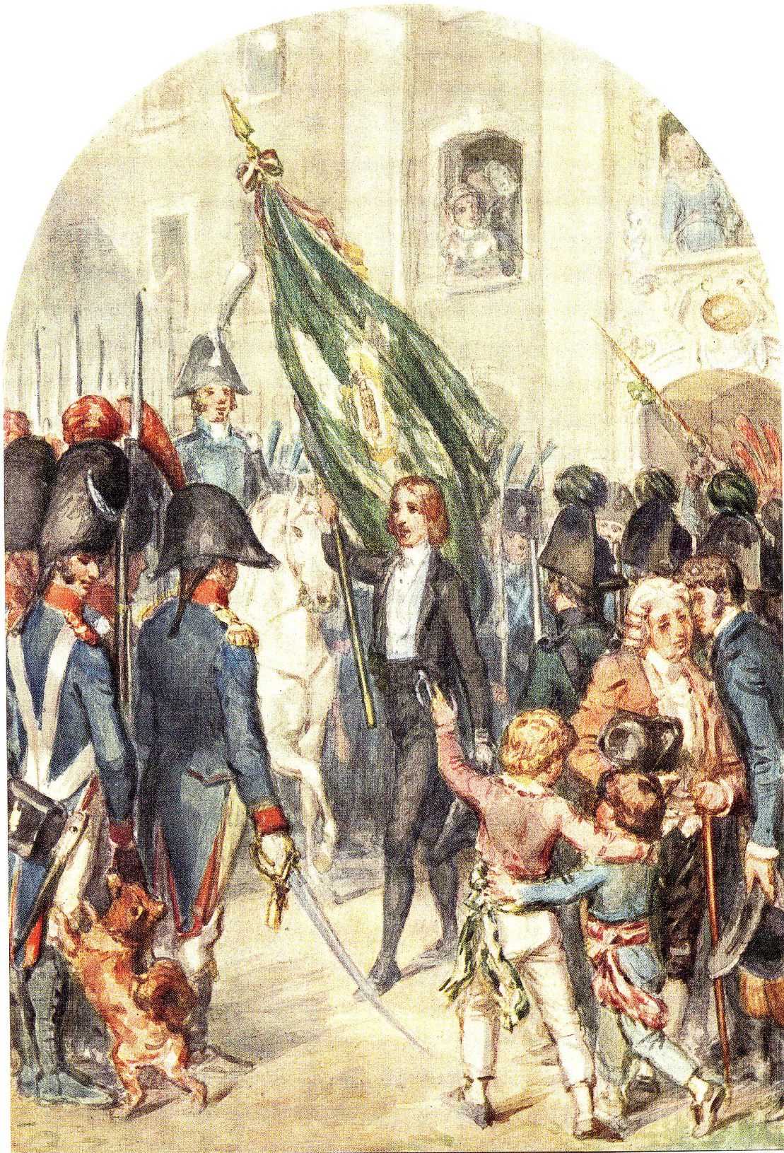
Müller-Friedberg tritt mit der im Frühling 1803 geschaffenen St. Galler Kantonsfahne aus dem Regierungsgebäude ins Volk hinaus