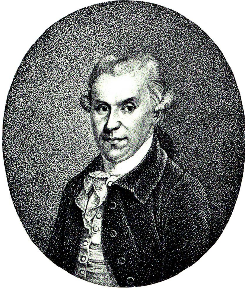
Johann Ludwig Ambühl (1750–1800) von Wattwil schuf Gedichte und vaterländische Dramen. Als Hauslehrer in Rheineck nahm er regen Anteil an der Befreiung des Rheintals