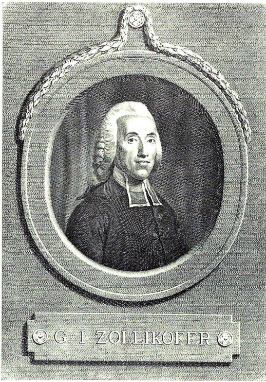
Georg Joachim Zollikofer (1730–1788) wirkte dreißig Jahre als berühmter Kanzelredner in Leipzig. – Nach einem Gemälde von A. Graff, gestochen von J. F. Baux

Weise angehört werden könnten wie von Christen. Das die Worte behutsam wählende Urteil des Freundes Lavater aber nennt Zollikofer einen «feinzarten, heldenkenden, ruhigen, wohl überlegenden, zu einer lichtdeutlichen Religion bestimmten Mann, der alles mit Weisheit, Anstand, Gefälligkeit, Ruhe und Frömmigkeit tut». Die weltoffene Art des Predigers brachte es mit sich, daß zu seinen Füßen besonders viele Kaufleute saßen. Nach seinem Tode erschienen daher nicht nur viele Bände seiner Predigten, sondern auch ein Bändchen über die «Moral der Kaufleute», in dem wir wohl ein Fortwirken des besten Ethos seiner Vaterstadt annehmen dürfen.