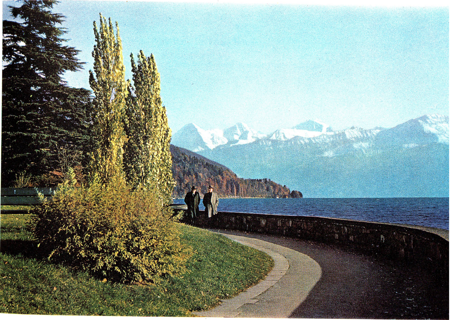
Illustration einer Werbebroschüre in Vierfarben-Offsetdruck der graphischen Anstalt E. Löpfe-Benz AG., Rorschach