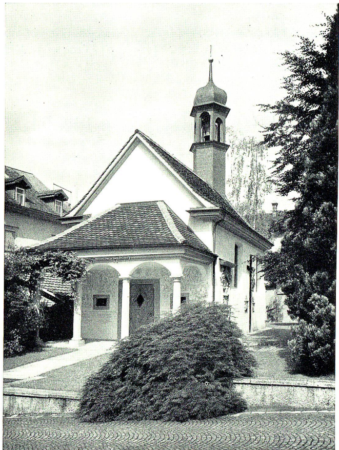
Seelenkapelle von Westen

Wann in Rorschach eine eigene Pfarrei errichtet wurde, ist ungewiß. Erst um 1236 erfahren wir erstmals urkundlich davon. Es ist aber anzunehmen, daß sie bedeutend älter ist. Die heutige Pfarrkirche geht auf die Anlage von 1438 zurück. Sie