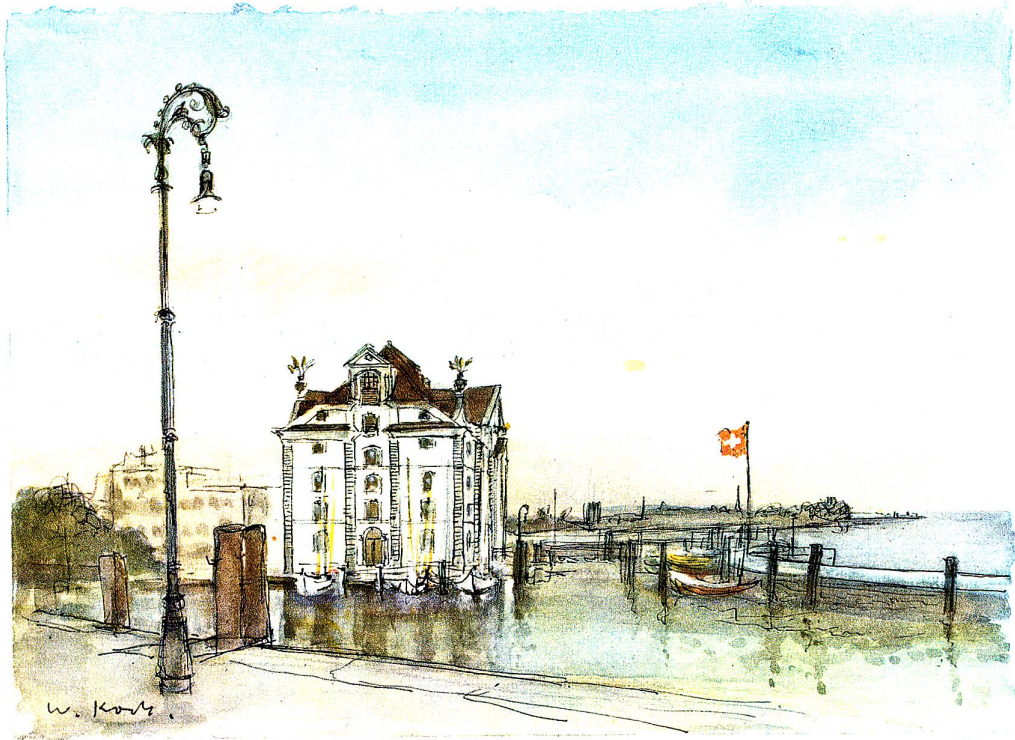
Hafen und Kornhaus

Freunden durch den Rorschacher Wald streifte und zu einer Edelkastanie geführt wurde, erzählte mir einer von ihnen, der Zeichner, nach dessen Heften Zehntausende von Kindern ihre festen Striche übten, sei auch ein unvergleichlicher Nachahmer der Vogelstimmen gewesen, habe er es doch fertig gebracht, mit der Lockstimme des liebenden Vogels den Partner zur Stelle zu pfeifen. Wo