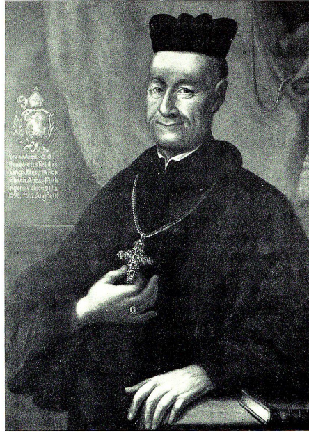
Abt Benedikt Rennhas von Fischingen 1598–1604