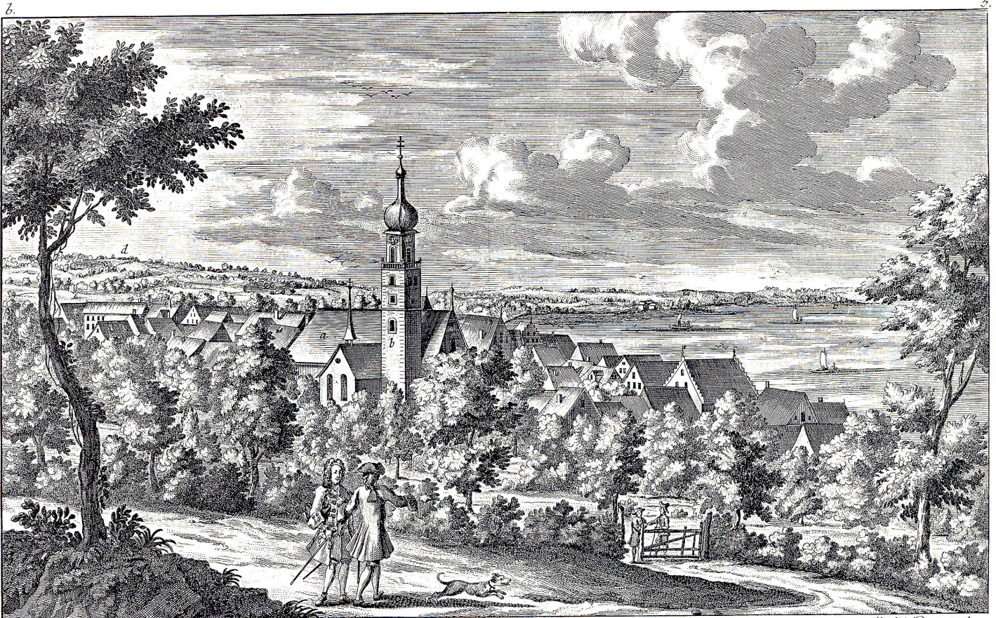
Rorschach, ein schöner Markt Flecken, welcher dem Herrn Abte von St. Gallen gehört ist wegen seines Hafens einen großen Handel treibet. a. Die Pfarr Kirche. b. Der hohe u. schöne Thurm. c. Das Stumijer-Horn. d. Das Thurgewit. Rorschach un beau Bourg, qui appartient au Monsieur l'Abbe de S. Gal, et à cause de son port a un grand negeoce. a. L'Eglise Paroissiale. b. La haute et belle tour. c. Le Stumijer-Horn. d. Le Thurgewit