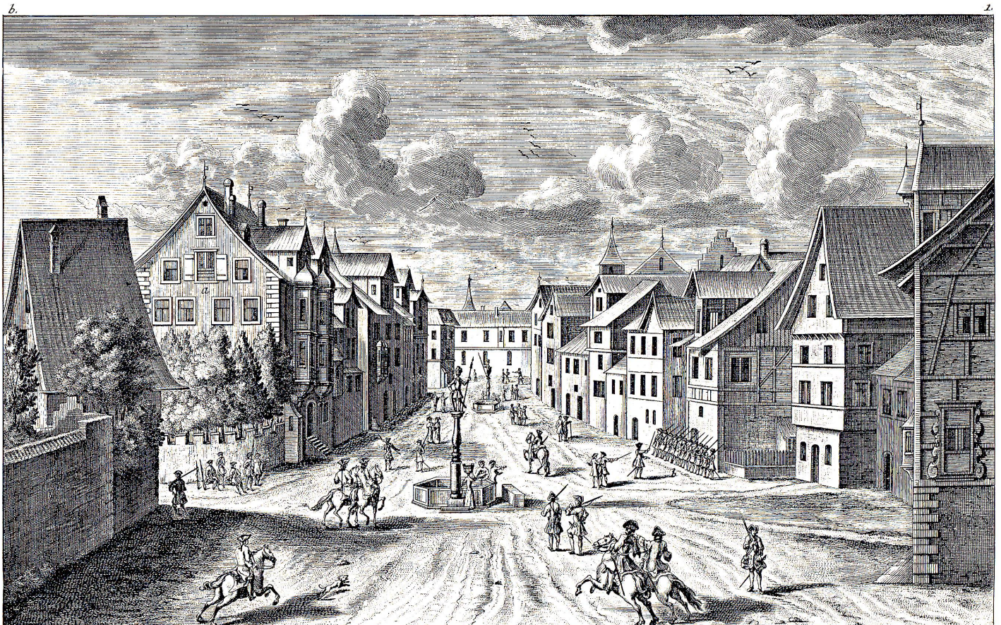
Ein schöner Prospect in Rorschach, a Die Wohnung dieser Herren Feyer, in welchem An. 1712. die Generalität logirt gewesen, b Die Haupt- Wache von beiden löblichen Ständen.

Unermüdlich zog der Abt jetzt bewährte auswärtige Kaufmannsfamilien in den Reichshof, die ihm die Manufaktur aufbauen helfen sollten. Er gewährte ihnen freie Wohnung, Steuererlaß für die Anfangsjahre und andere Vorrechte und förderte das Gewerbe durch die Anlage von Bleiche, Farb