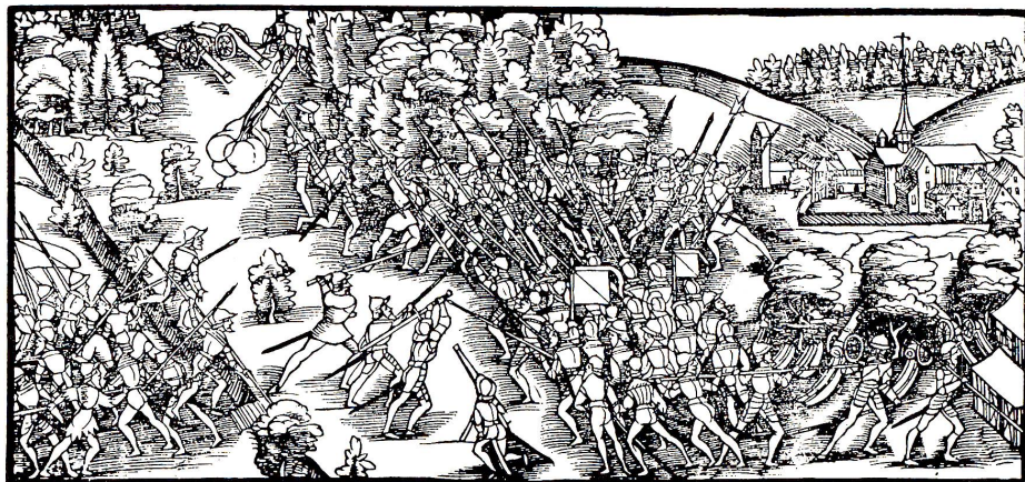
Abbildung 8 Hans Asper: «Streyt zu Cappel». Niederlage der Zürcher und Tod des Reformators am 11. Oktober 1531, in der Nähe des Klosters Kappel. Holzschnitt aus der Chronik des Johannes Stumpf, Zürich 1547/48

Zwinglis Gutachten da und dort begegnen, dürfen wir im Reformator deshalb noch lange nicht den allmächtigen Lenker der zürcherischen Politik sehen. Der Rat machte zürcherische, nicht zwinglische Politik, wenn auch Zwinglis überragende Persönlichkeit manchen mäßigen und wenig selbständigen, aber auch manchen ihm geistig verwandten Kopf durch die Kraft und Lebendigkeit seiner Ideen zu beeinflussen vermochte. Und schließlich – warum sollte nicht auch Zwingli «zürcherische» Politik machen? Wo er allzu radikal vorgehen wollte, verweigerte ihm der Rat die Gefolgschaft. So sind zweifellos die Krisen zu erklären, die das Verhältnis Zwinglis zu seiner Obrigkeit trübten; im Sommer 1529 und nochmals wenige Monate vor seinem Tode wollte sich Zwingli von Zürich abwenden und anderswo ein Auskommen suchen. Er war verzweifelt darüber, seinen Einfluß in Zürich selbst immer mehr schwinden zu sehen 48 .