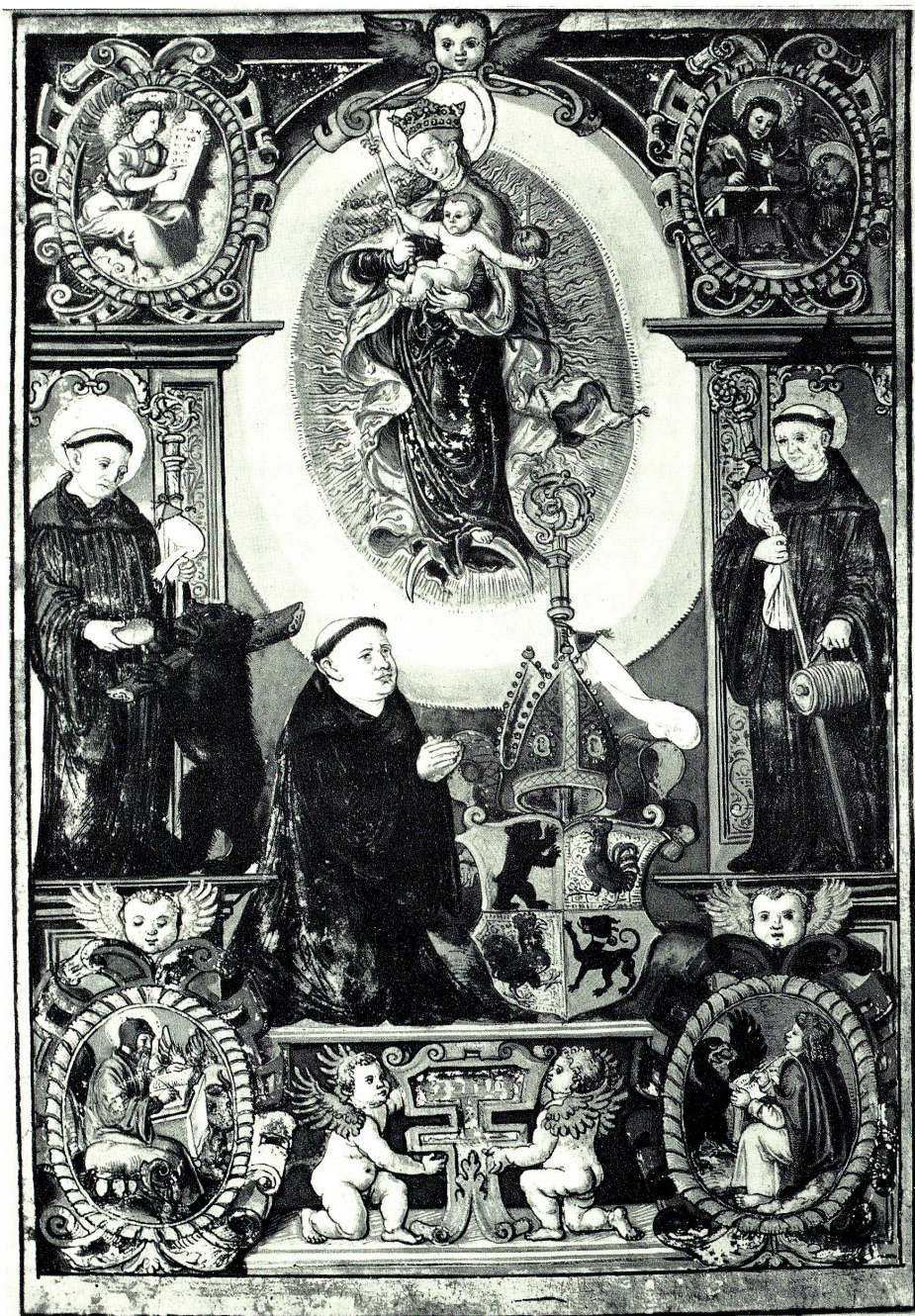
Abbildung 9 Titelminiatur einer verschollenen Handschrift, die Abt Diethelm Blarer von Wartensee um 1550/55 anfertigen ließ. Er selber ist neben seinem Wappen knieend dargestellt. Während seiner Regierungszeit (1530–1564) wurde 1532 das Kloster St. Gallen wiederhergestellt und die Reformation in den Stiftsgebieten rückgängig gemacht.