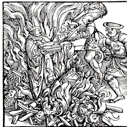
Abbildung 5 Heinrich Vogtherr: «Bilder uss dem Münsther thon». Die Bilder aus dem St. Galler Münster werden auf dem Brühl verbrannt. Holzschnitt aus der Chronik des Johannes Stumpf, Zürich 1547/48

geworfen, bevor der Tod von Abt Franz überhaupt bekannt wurde! Die geharnischte Reaktion der überlisteten Zürcher ließ auch nicht lange auf sich warten. Am Ostersonntag war Freis Mitteilung von der Wahl Kilians eingetroffen, schon am nächsten Tag erging von Zürich aus ein Haftbefehl gegen den neuen Abt 39 . Zürich war entschlossen, an seinen Plänen festzuhalten und auf den weiteren Ausbau seiner Machtposition in der Ostschweiz nicht zu verzichten. So griff man die Anregung Freis auf, dem neuen Abte die Rechtmäßigkeit der Wahl zu bestreiten. Frei hatte nämlich mitgeteilt, daß während der Wahl drei Mitglieder des Konventes in St. Gallen geblieben seien, weshalb er diese schnelle Wahl befremdlich finde 40 . Bald waren noch weitere Argumente gefunden. Die Wahl war ohne Wissen des Schirmhauptmannes und der beiden Orte Zürich und Glarus erfolgt, während Luzern und Schwyz durch ihre Boten vertreten waren. Überdies hatte sie an einem fremden Orte, eben in Rapperswil, und nicht wie gewohnt in St. Gallen selbst stattgefunden. Waren diese Argumente stichhaltig? Im Schirmvertrag war nirgends festgelegt, daß der Schirmhauptmann oder die Boten der Schirmorte bei einer Abtwahl anwesend sein mußten. Die Zürcher mach-