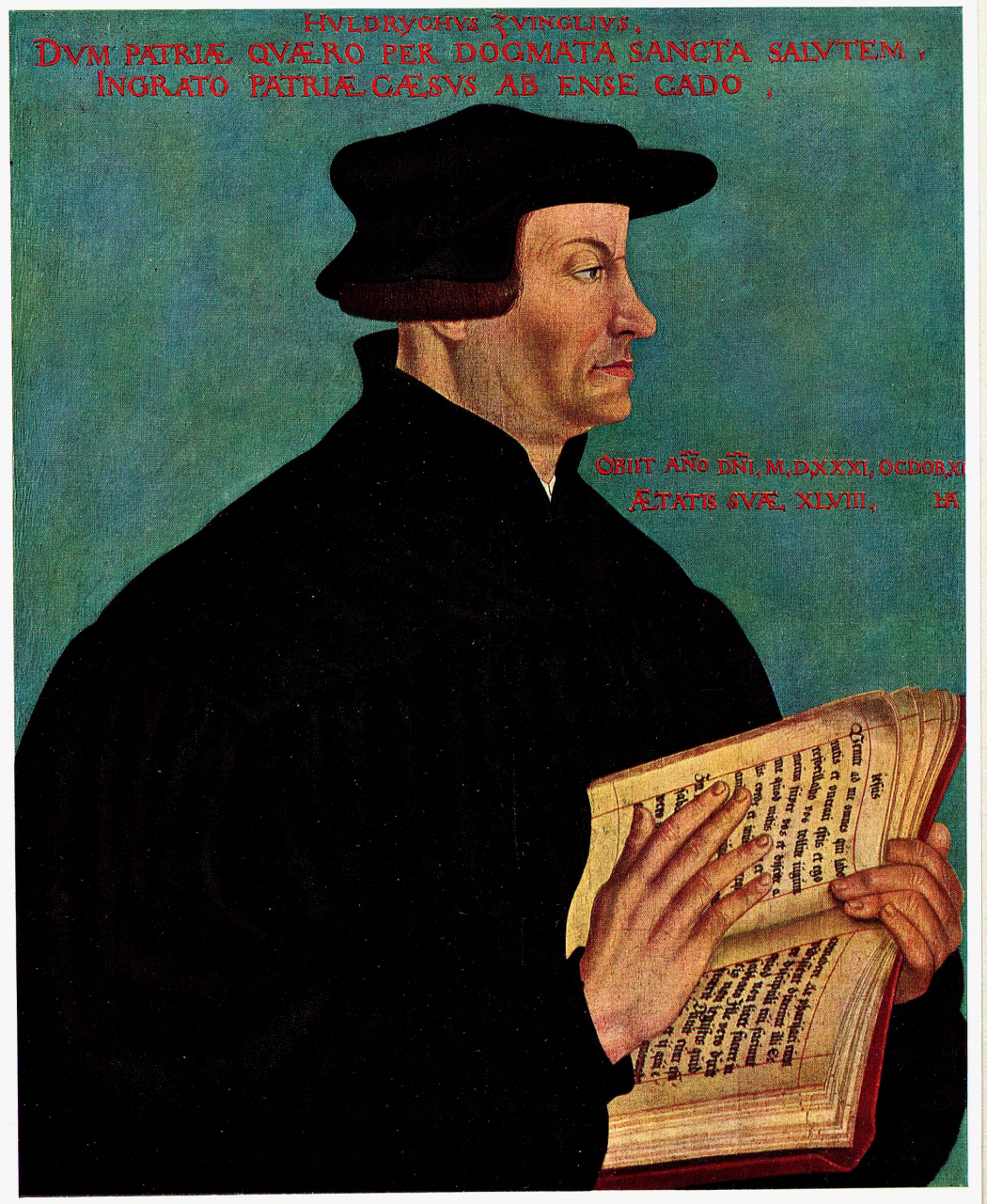
Abbildung 1 Hans Asper: Huldrych Zwingli. 1549 (Zentralbibliothek Zürich)

Vierfarben-Buchdruck, E. Löpfe-Benz AG, Rorschach