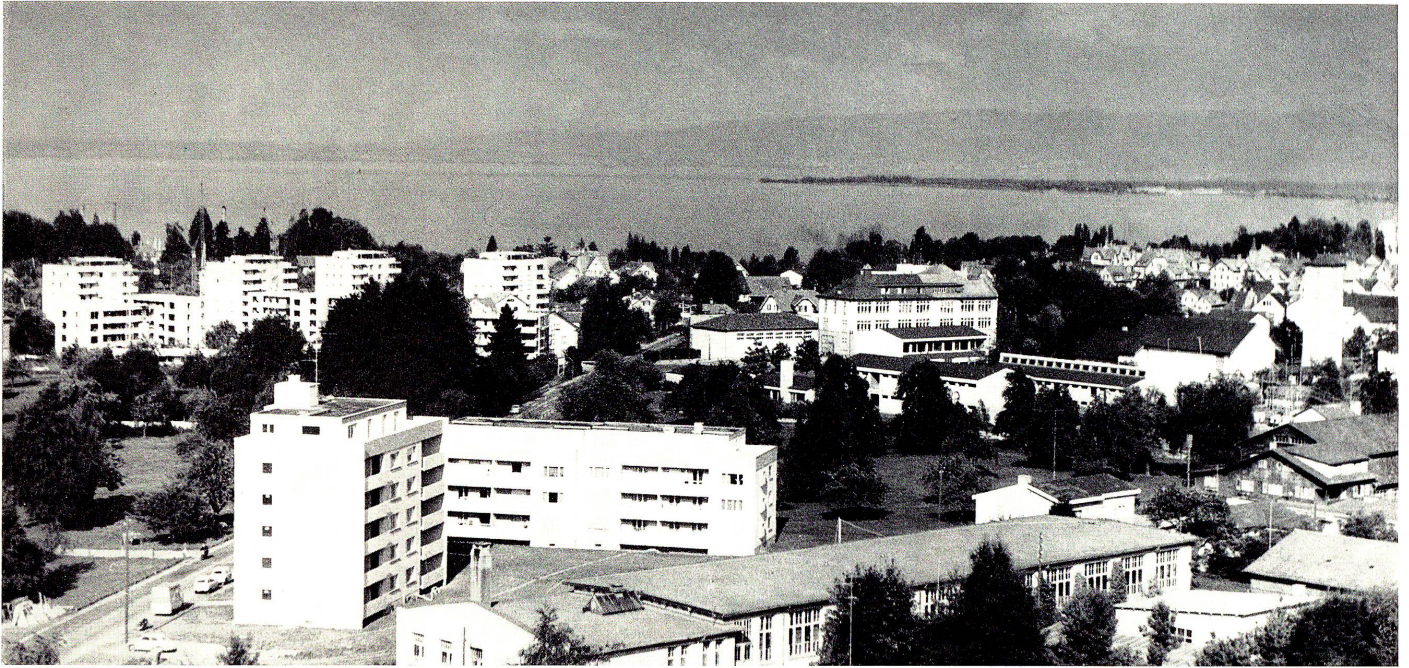
Vom gleichen Standort aus schweift der Blick über moderne Wohnbau- und Schulanlagen hinweg gegen den See und die deutschen und österreichischen Ufer

Zu diesem vorwiegend geschichtlichen Stoff schrieb Albert Gantner eine Festspielmusik, die keineswegs historisierend konzipiert war, sondern in leicht moderner Manier das Spielgeschehen klanglich-melodisch akzentuierte. Diese Musik, unter der Stabführung des Komponisten vom Orchesterverein Goldach gespielt, packte die Besucher von der Ouvertüre bis zum Schluß. Die von Hermann Unseld geschaffenen Bühnenbilder verzichteten auf naturalistische Gestaltung und unterstrichen mit ihren abstrakten Elementen die Symbolhaftigkeit des ganzen Festspiels.