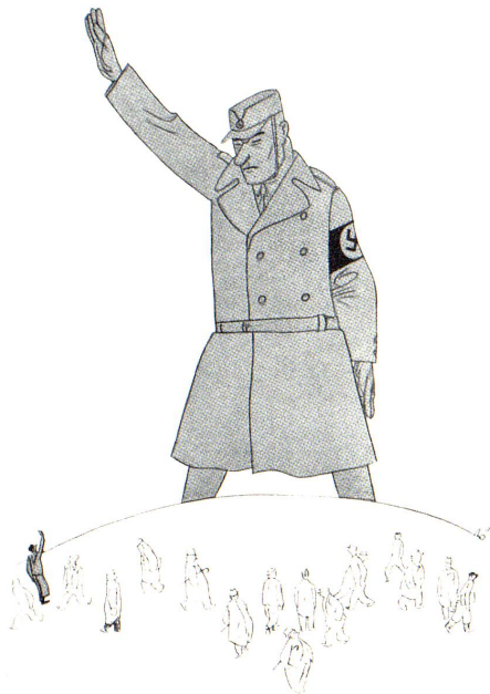
Die Welt ist mein Zeuge! Da schreit schon wieder ein Volk nach Erlösung.

draußen an Versuchen, der humoristisch-satirischen Wochenschrift die Narrenfreiheit zu beschränken. Das deutsche Regiment, dem mit der Seele auch echte Heiterkeit abging, versuchte dem «Nebelspalter» einen Maulkorb umzulegen, denn er wurde trotz allen Verboten und Drohungen in beträchtlichen Stößen immer wieder über die Grenze in die deutsche Nachbarschaft geschmuggelt. Der deutsche Gesandte wurde schließlich bei Bundesrat Motta vorstellig und erklärte, diese freimütige Sprache des «Nebelspalter» sei umso anstößiger, als sein Herausgeber Vizepräsident des schweizerischen Ständerates sei. Da holte unser «Außenminister» Bundesrat Motta die Bundesverfassung vom Buchgestell und schlug den Artikel 55 auf, welcher allen Schweizern, also auch Parlamentariern, die Pressefreiheit gewährleistet. Die totalitär gesinnten Anhänger des Dritten Reiches konnten nicht verstehen, daß der freiheitliche neutrale Staat seiner Presse keine Gesinnungsneutralität auferlegte. Die Schweizer Zeitungen waren eben nicht die «Stimme der Schweiz», sondern nur Stimmen in der Schweiz. Der Bundesrat tat sicher gut daran, nicht von dieser Linie abzuweichen: im Falle einer Vorzensur hätte man ihm ja jede ausfällige Bemerkung als behördlich gebilligt angekreidet. Daß es auch so noch