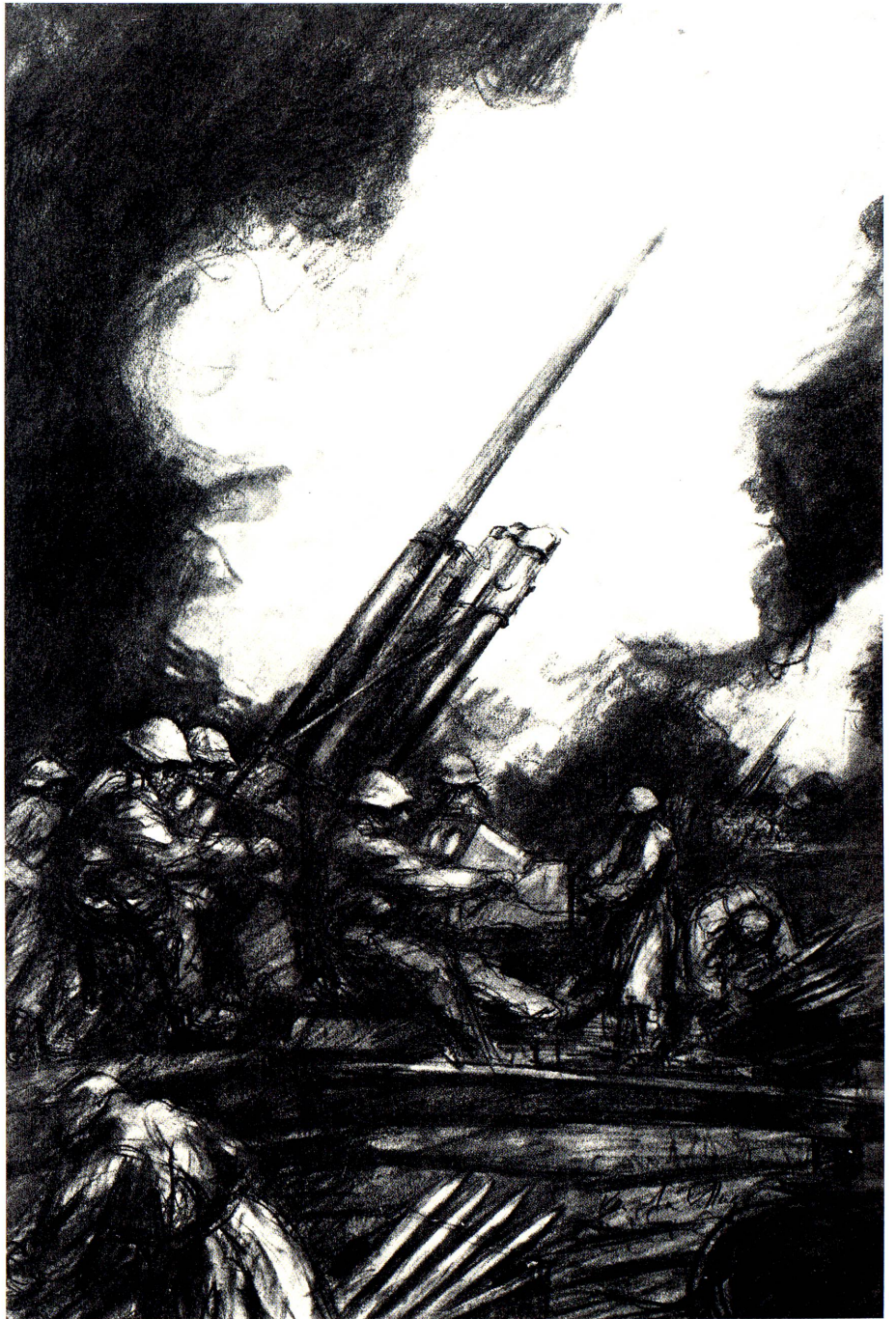
Schweizer Wehrbereitschaft. Zeichnung des Soldaten Charles Hug. Soldat in einer Mot. Kan. Bttr.

Das einfache Volk und besonders die im Mai zur zweiten Mobilmachung aufgebotenen Soldaten verstanden solche Worte nicht. War der Bundesrat etwa auch zu einer innern Evakuierung bereit, ähnlich wie viele Städte des Mittellandes in den kritischen Tagen mit eilig zusammengeraffter Habe den Alpentälern zustrebten, wo manche Reiche ihr «Angschthüüsi» besaßen? In solcher Unsicherheit bedurfte es eines mannhaften, wegleitenden Wortes. General Guisan sprach es auf dem Rütli, wohin er die höchsten Offiziere zum Rapport zusammenrief. Diese Zusammenkunft vom 25. Juli auf der Stätte, welche im Volke als Wiege der Freiheit galt, wirkte gleichnishaft als eine Erneuerung des Schwures aus der Zeit des Ursprunges der Eidgenossenschaft. Und wie die alten Schweizer Freiheitskämpfer aussichtslos erscheinende Kämpfe gegen übermächtige Gegner im Bunde mit der Berglandschaft gewonnen hatten, so entwickelte der General nun einen neuen Wehrplan, der sich ebenfalls an die Alpenfestung stützte. Statt der bisherigen «Grenzbesetzung», wo jeder Streifen Schweizer Boden zu verteidigen war, sollte im Falle eines alles niederwalzenden Angriffs moto-