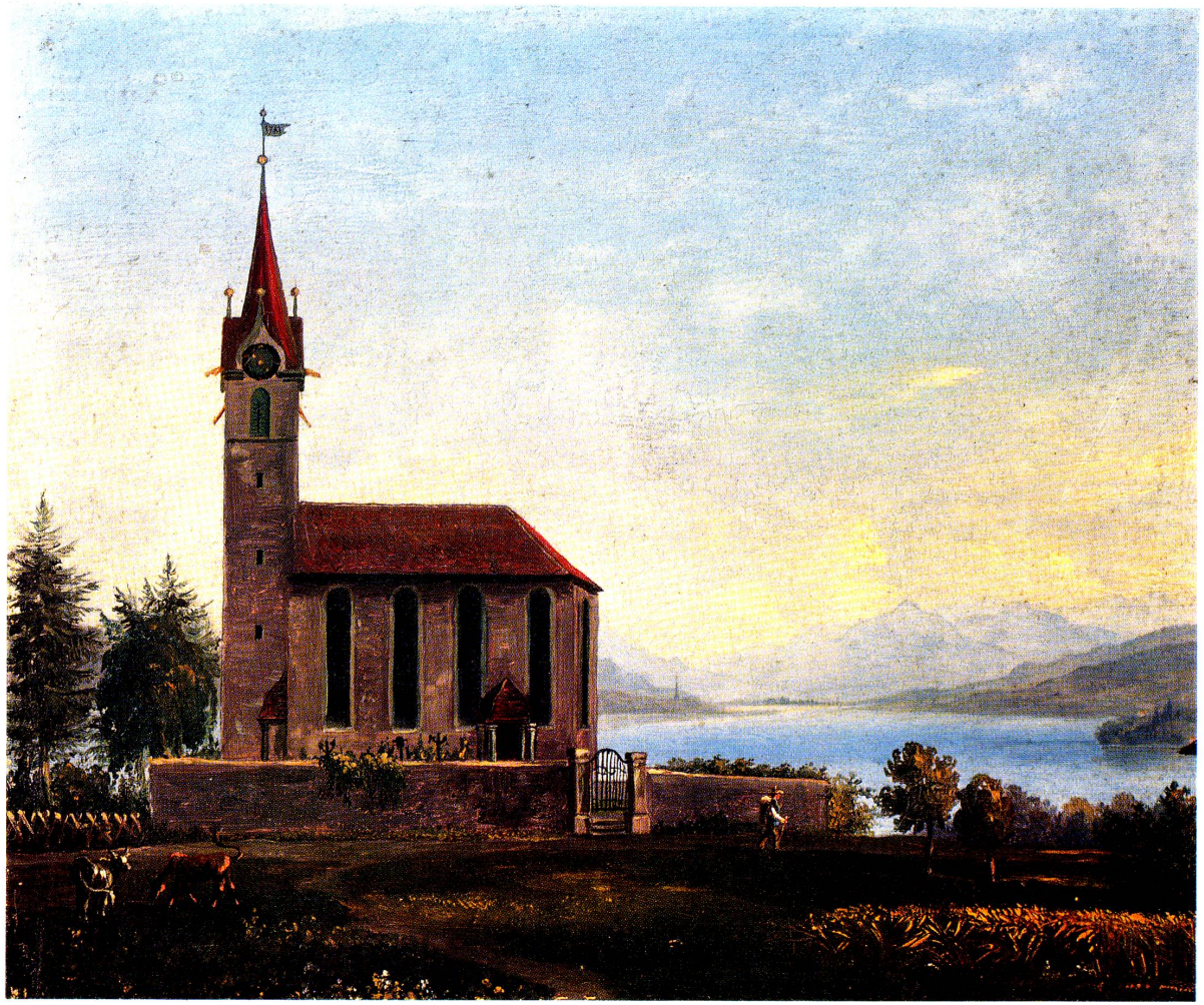
Oberrieden am Zürichsee Vierfarben-Buchdruck aus «Oberrieden Kirche und Dorf», gedruckt bei E. Löpf-Benz AG Rorschach