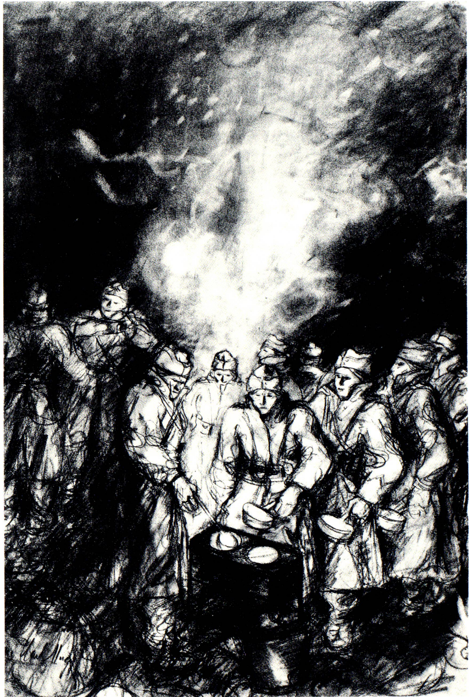
Verpflegung im Felde, Zeichnung von Charles Hug aus St. Gallen. (Aus dem Buch «Rost und Grünspan» mit freundlicher Bewilligung des Artemis-Verlages Zürich)

Der Erfolg dieser ungehemmten Machtpolitik, aber auch der rauschhafte Einschlag der «Bewegung» gegenüber herkömmlicher Politik, welche vorab der Jugend als ein wenig verlockendes Treten an Ort erschien, zündete wetterleuchtend über die Landesgrenzen hinweg. War es schon in der Schweiz wenige Wochen nach Hitlers Aufstieg zur Macht zum «Frontenfrühling» gekommen, in welchem vorab junge Burschen nach einem mehr oder weniger schweizerischen Gegenstück der Erneuerungen im südlichen und im nördlichen