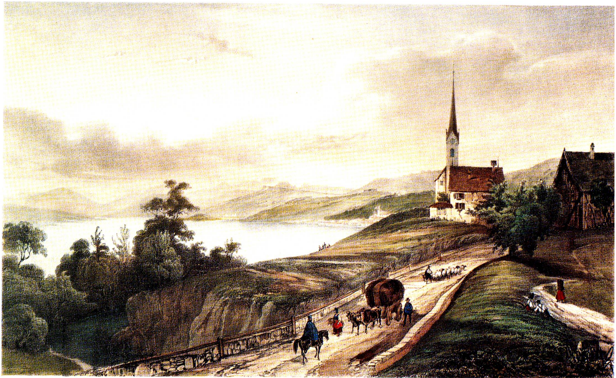
Oberrieden am Zürichsee Vierfarben-Buchdruck aus «Oberrieden Kirche und Dorf», gedruckt bei E. Löpf-Benz AG Rorschach