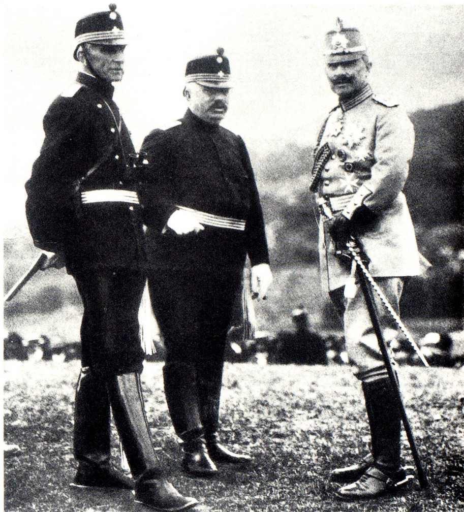
Generalstabs-Chef Theophil Sprecher von Bernegg und Oberstkorpskommandant Ulrich Wille im Gespräch mit dem deutschen Kaiser Wilhelm II., der die Herbstmanöver 1912 bei Kirchberg im Toggenburg besuchte.

Nach der Truppenordnung von 1912 gehörte der Kanton St.Gallen nebst den Kantonen Thurgau, Appenzell, Glarus und Graubünden zum 6. Divisionskreis. Die Wehrmänner aus den südlichen Bezirken Werdenberg, Sargans und Gaster sowie aus den obersten Gemeinden des Toggenburgs bildeten das Gebirgsregiment 35 (Bat. 76 und 77). Die übrigen st. gallischen Gebiete stellten den Infanterie-Auszug der Regimenter 32 (in dem auch das Glarner Bataillon 85 diente) und 33 (Bat. 78 bis 82). Daneben rückten zwei Dragoner-Schwadronen und eine Schützenkompagnie ebenfalls zum Auszug ein, während in der Landwehr 3 Füsilierbataillone, 1 Gebirgsbataillon und 1 Dragoner-Schwadron Dienst leisteten. Die Mobilmachung der St.Galler Truppen vollzog sich ruhig nach den Weisungen des kantonalen Polizei- und Militärdepartementes. Sie leisteten auf den Korps sammelplätzen St.Gallen, Wil und Rapperswil ihren Fahneneid.