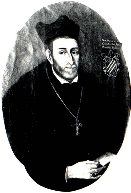
Fürstabt Pius Reher, 1650–1654.

gendtes unbeweglich gueth, es seye an akern, weingarten, wysen, holz, feld, wäld, waiden, häusern, städlen, scheuren, torckhlen samt den hofstäten, ewigen gülden, zehenden und dergleichen in främbder hände, ohne unsere vorhergendte, ausdrückliche erlaubnusz um geldt, oder geldtswerth zu verkaufen und zu verwenden, bemächtiget, sondern alle dergleichen, ohne unsere erlaubnusz getroffene käuff und veränderungen an der that, selbst ungültig, nichtig und kraftlos haïßen und seyn, darusz weder dem käuffer noch dem verkäuffer einige rechtsami spruch oder forderung gebühren soll 72 . »