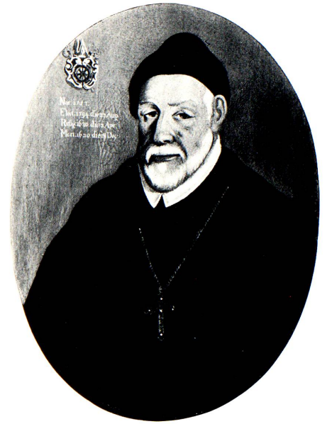
Fürstabt Bernhard Müller. 1594–1650.

Das Gotteshaus St. Gallen war ein zugewandter eidgenössischer Ort; zu gleicher Zeit aber war sein Abt Fürst des Heiligen Römischen Reiches Deutscher Nation; als solcher empfing er die Belehnung mit den Regalien; als solcher schuldete er aber auch in grundsätzlichen Angelegenheiten dem Kaiser Gehorsam. Das Stift St. Gallen pflegte die freundschaftlichen Beziehungen zum Reich und