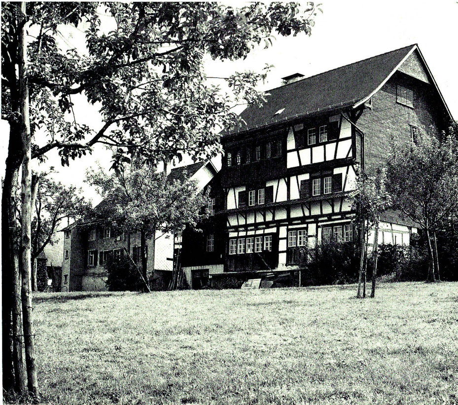
Teils als Riegelbau, teils geschindelt, blickt das Haus Rappenstein von seiner Höhe weit über die thurgauischen und sanktgallischen Lande am See: Das liebevoll restaurierte alte Haus ist mehr als ein Zuhause, es bedeutet auch einen geistigen Standort.

für ihn wurde in Ferientagen in der alten Luzerner Heimat das Kennenlernen der von Hans Stocker, Basel, ausgemalten St.Karli-