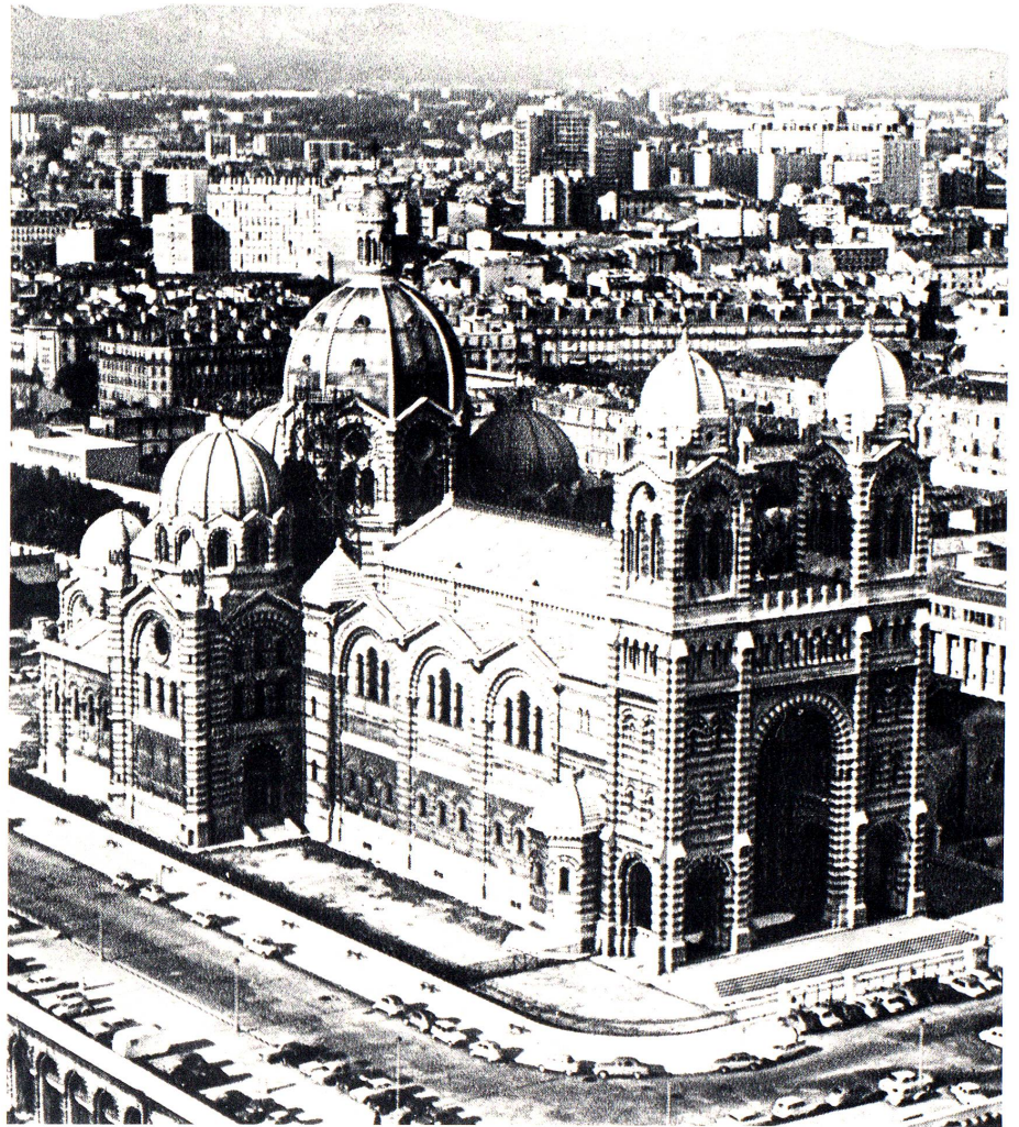
Die Kathedrale Notre-Dame-la-Majeure in Marseille, erbaut unter Bischof Eugène de Mazenod in den Jahren 1852–1895.

Am 27. März 1830 weihte ihn Erzbischof de Richéry in der Kathedrale St-Sauveur in Aix-en-Provence zum