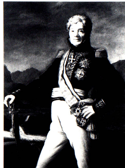
General Niklaus Franz von Bachmann. Ölgemälde von Felix Maria Diogg aus dem Jahre 1817 im Schweizerischen Landesmuseum in Zürich.

Die «Armee» der Republik Alte Landschaft kam nicht zum Einsatz. Der Regierung fehlte überhaupt der ernstliche Wille, es bis zum äussersten kommen zu lassen. Dem Volk, das selbst nach dem Fall Berns bereit war, die eben gewonnene Freiheit mit der Waffe zu verteidigen, blieb es nicht verborgen, wie die Kriegsvorbereitungen nur lässig betrieben wurden. Was Wunder, wenn es – und das nicht zu Unrecht – in seinen Führern Anpasser und Franzosenfreunde witterte und seinen Unmut auch offen und laut zum Ausdruck brachte. Indessen nahte der 24. April, an dem über die Aufforderung des französischen Generals Schauenburg zur Annahme der helvetischen Konstitution abgestimmt werden musste. Zu Hunderten zo-