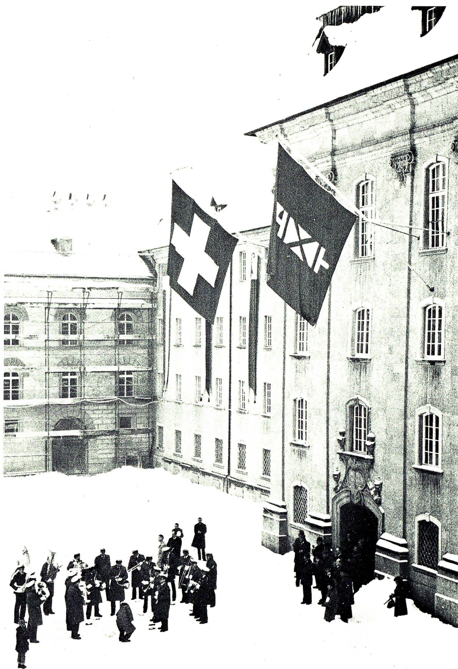
Jubiläumstag im Schnee. Die Polizeimusik St.Gallen bei ihrem Ständchen anlässlich der Jubiläumssitzung des Grossen Rates am 20. Februar. Im Hintergrund der sogenannte Zeughausflügel, dessen Renovation nunmehr praktisch abgeschlossen ist.

Man wird darüber hinaus beachten dürfen, dass in diesem Jubiläumsjahr eine ganze Anzahl weiterer grosser Werke vollendet, entscheidend gefördert oder grundgelegt wurden, die von einem lebendigen Staat in allen Sparten zeugen. Beispielsweise wurde mit dem Übergang der Stadtbibliothek Vadiana an den Kanton eine wichtige Umschichtung im Bereich der Kultur getroffen. Die Eröffnung der landwirtschaftlichen Schule in Sennwald ist von ebenso grosser wirtschaftlicher Bedeutung wie die Inbetriebnahme der Kraftwerke des Sarganser-