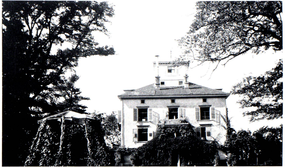
Villa Mariahalde vor dem Umbau von 1917. Ansicht von Süden (Parkseite). Photographie. Photoarchiv des Verfassers.

Ein mit Kandinsky befreundeter katholischer Geistlicher – es muss sich um Carl Ludwig Philipp Rady aus München handeln, der im übrigen