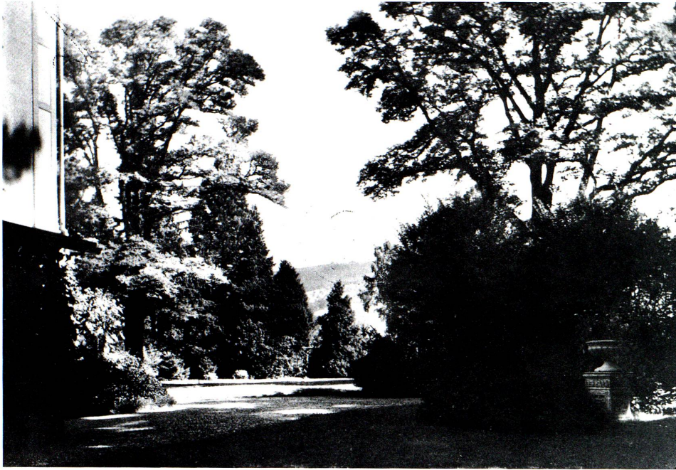
Park der Villa Mariahalde (Südseite) um 1922, Photographie.