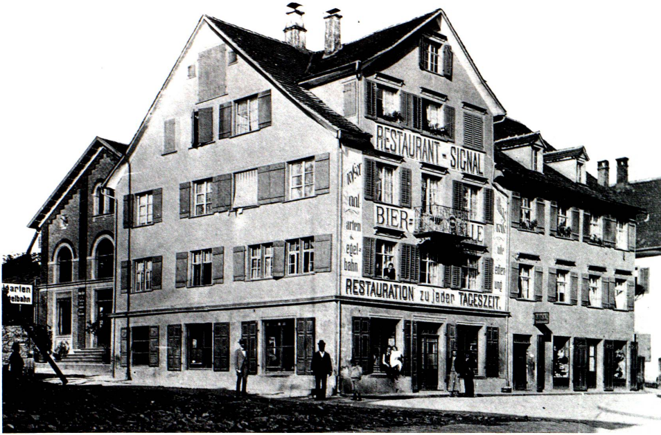
Hotel Signal, Photographie.