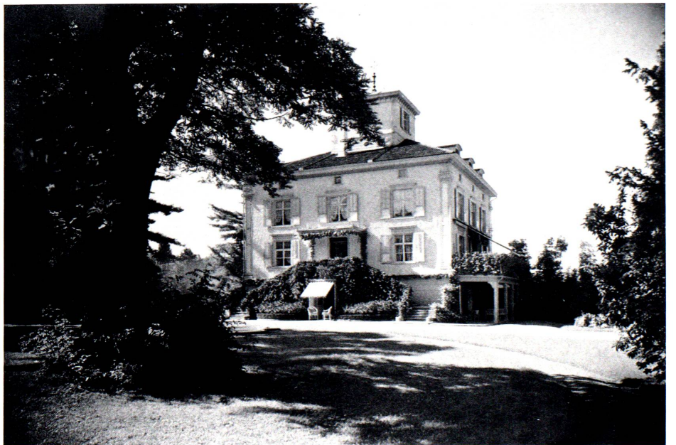
Villa Mariahalde nach dem Umbau von 1917. Ansicht von Süden (Parkseite). Photographie. Familienarchiv Philipp Lafont-Kriesemer, St.Gallen.