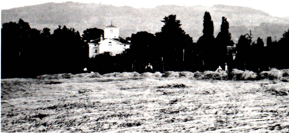
Villa Mariahalde, Ansicht von Norden aus Richtung Sonnenhaldenstrasse, Photographie.