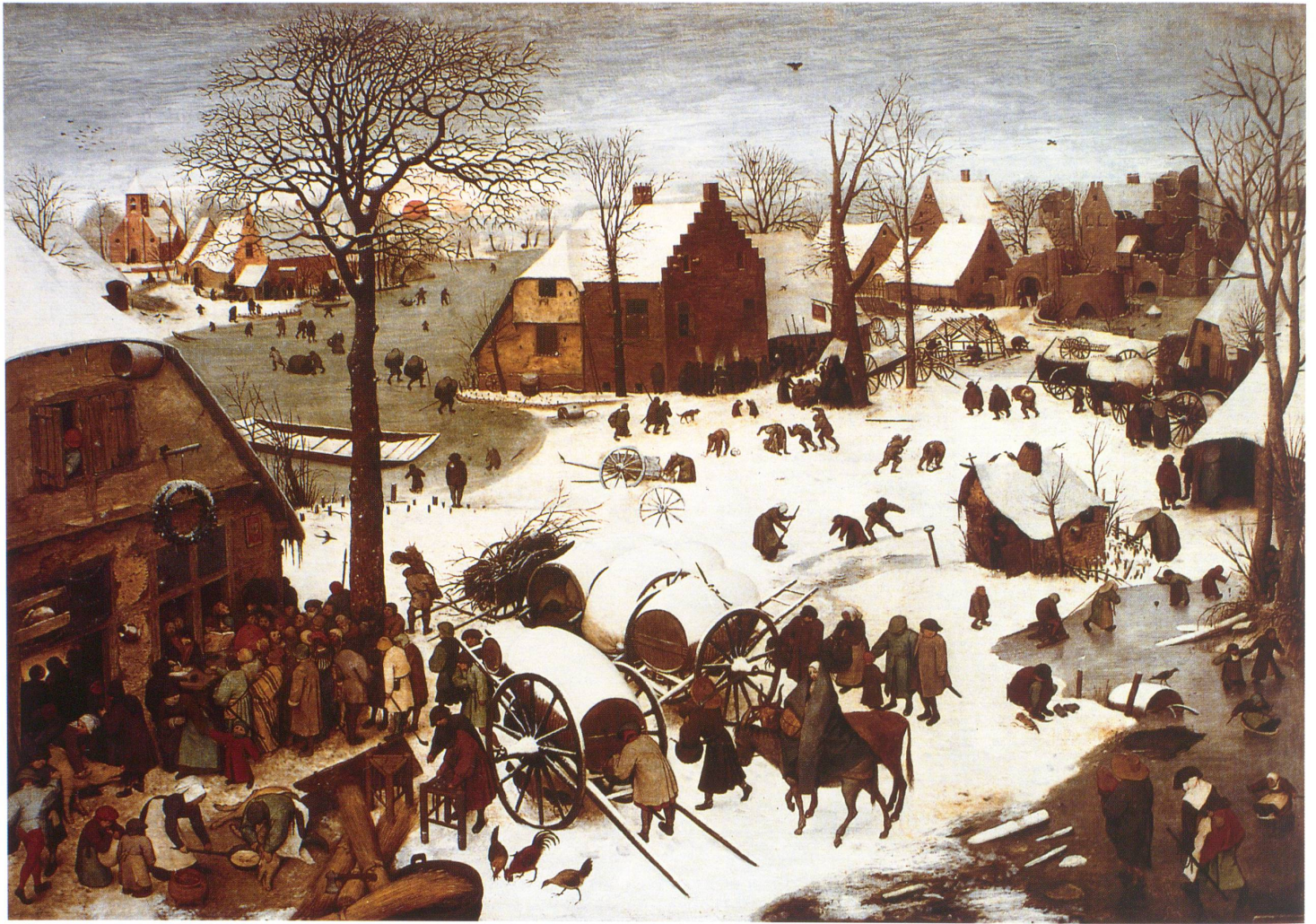
Pieter Bruegel d. Ä. (1527/28–1569), Die Volkszählung zu Bethlehem, Musées Royaux des Beaux-Arts de Belgique, Bruxelles.

In jenen Tagen erging vom Kaiser Augustus ein Befehl, das ganze Weltreich aufzuzeichnen. Dies war die erste Aufzeichnung. Sie fand statt unter Quirinius, dem Statthalter von Syrien. Alle gingen hin, um sich eintragen zu lassen, ein jeder in seine Vaterstadt.