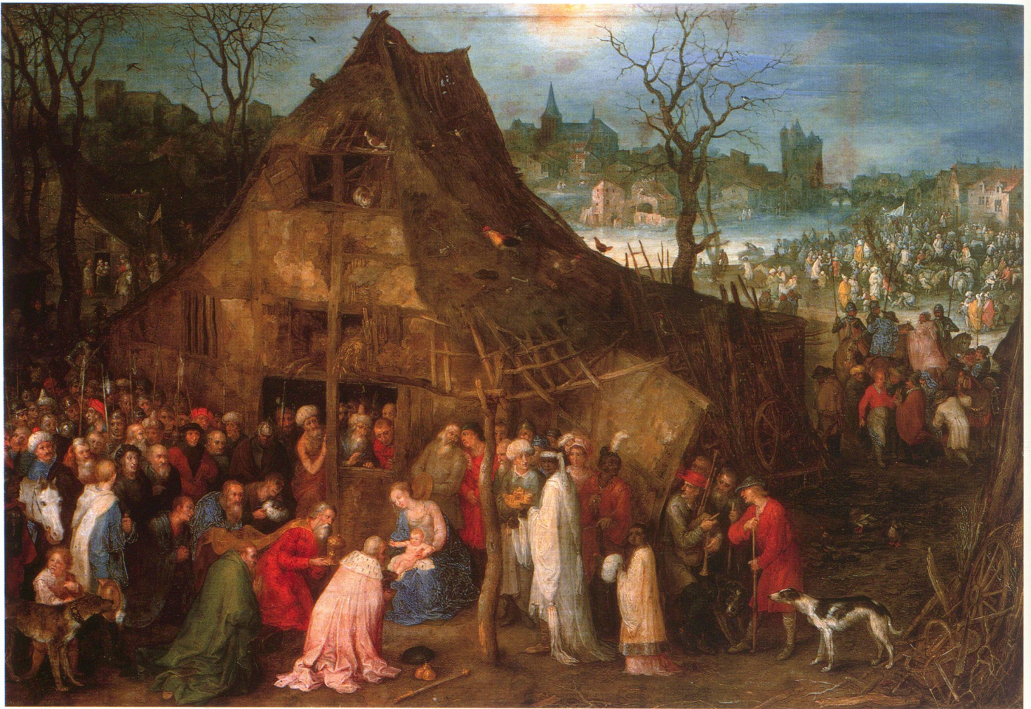
Jan Brueghel d. Ä. (1568–1625), Die Anbetung der Heiligen Drei Könige, Kunsthistorisches Museum, Wien.