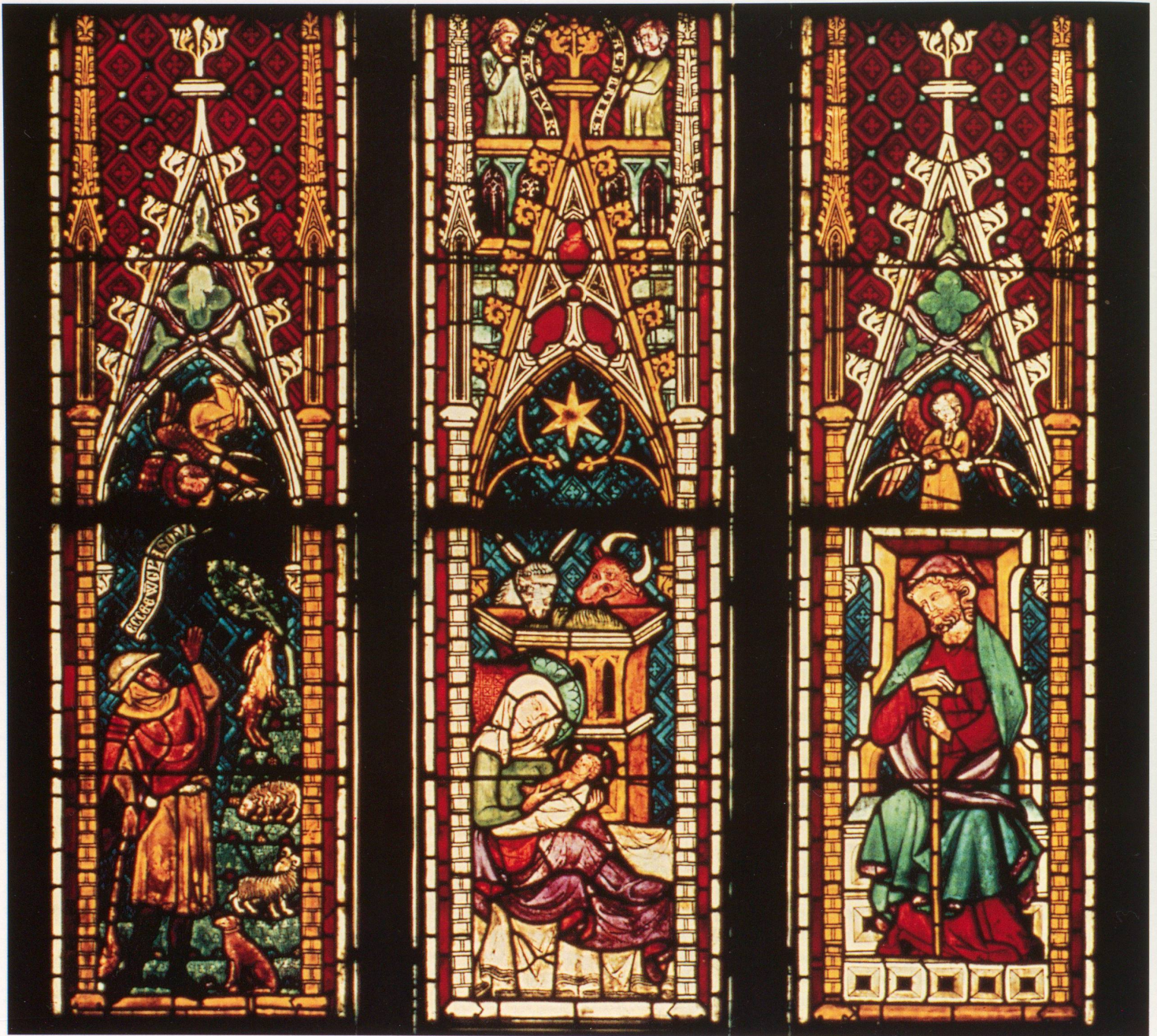
Die Verkündigung an einen Hirten und die Geburt Christi, Klosterkirche Königsfelden – Foto: Aargauische Denkmalpflege, Aarau.