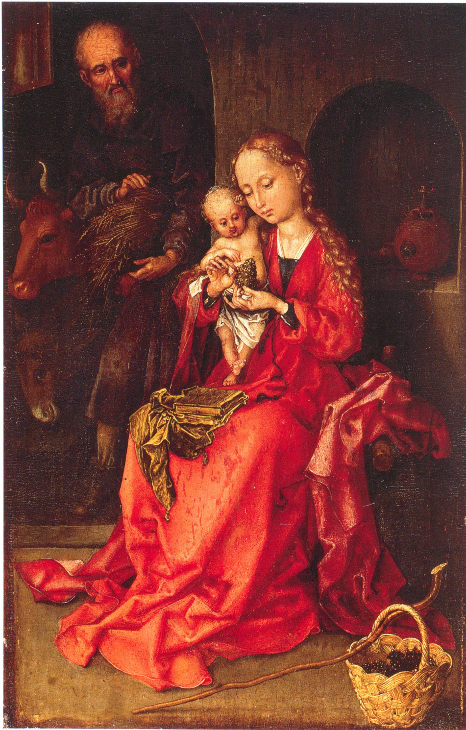
Martin Schongauer (1425/30–1491), Die Heilige Familie, Kunsthistorisches Museum, Wien.

Johannes von Hildesheim und über die «Entstehung der Sage» sind regelrechte kleine Abhandlungen. Am 6. Dezember ergänzt er diese und sendet sie an Goethe ab.