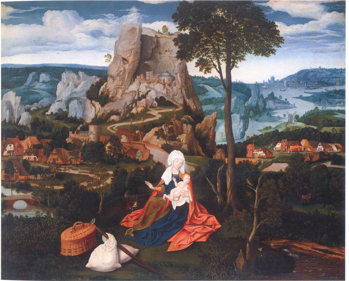
Joachim Patenier (um 1480–1524), Die Ruhe auf der Flucht nach Ägypten, Staatliche Museen Preussischer Kulturbesitz, Gemäldegalerie Berlin.