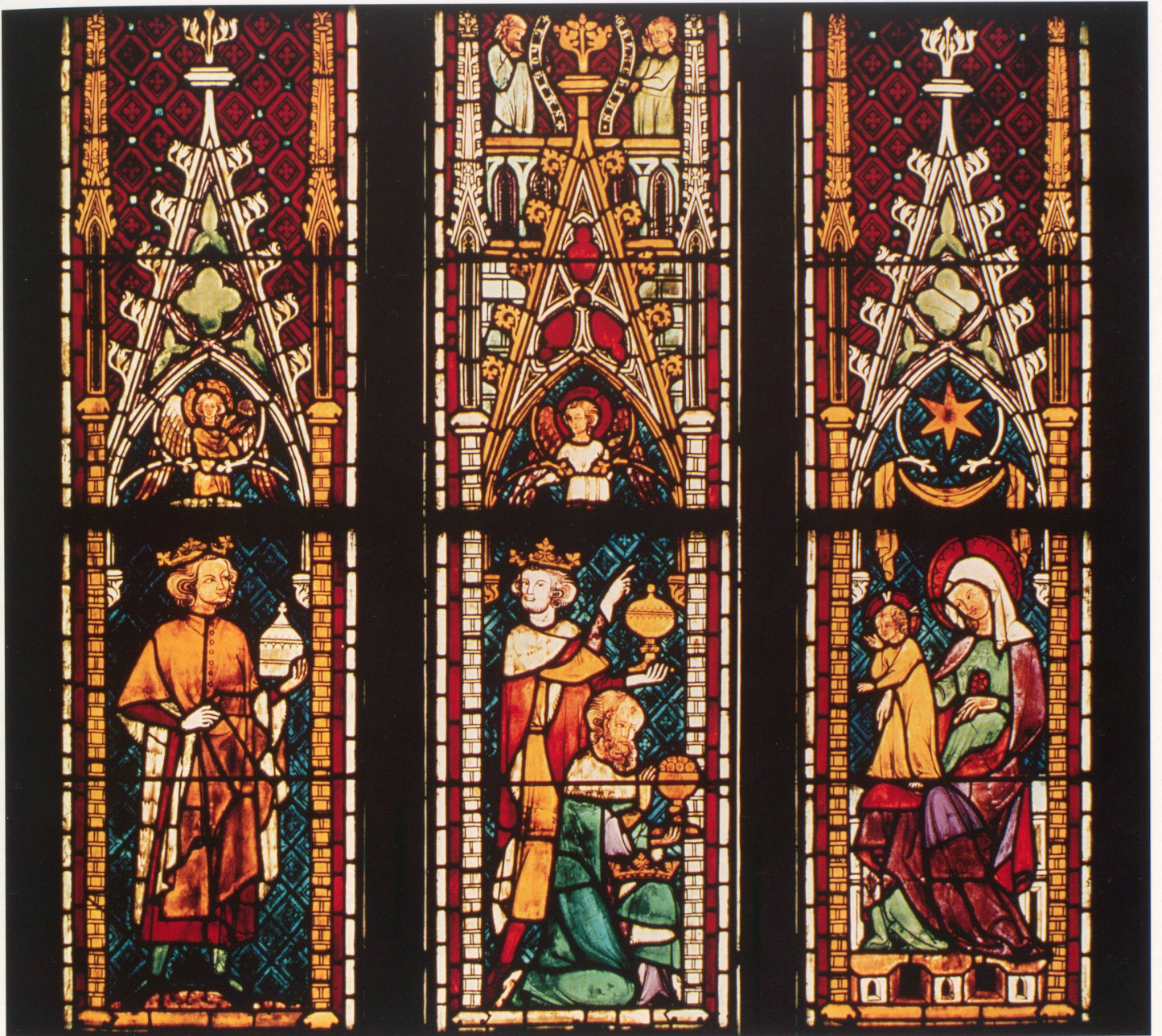
Die Anbetung der Heiligen Drei Könige, Klosterkirche Königsfelden – Foto: Aargauische Denkmalpflege, Aarau.