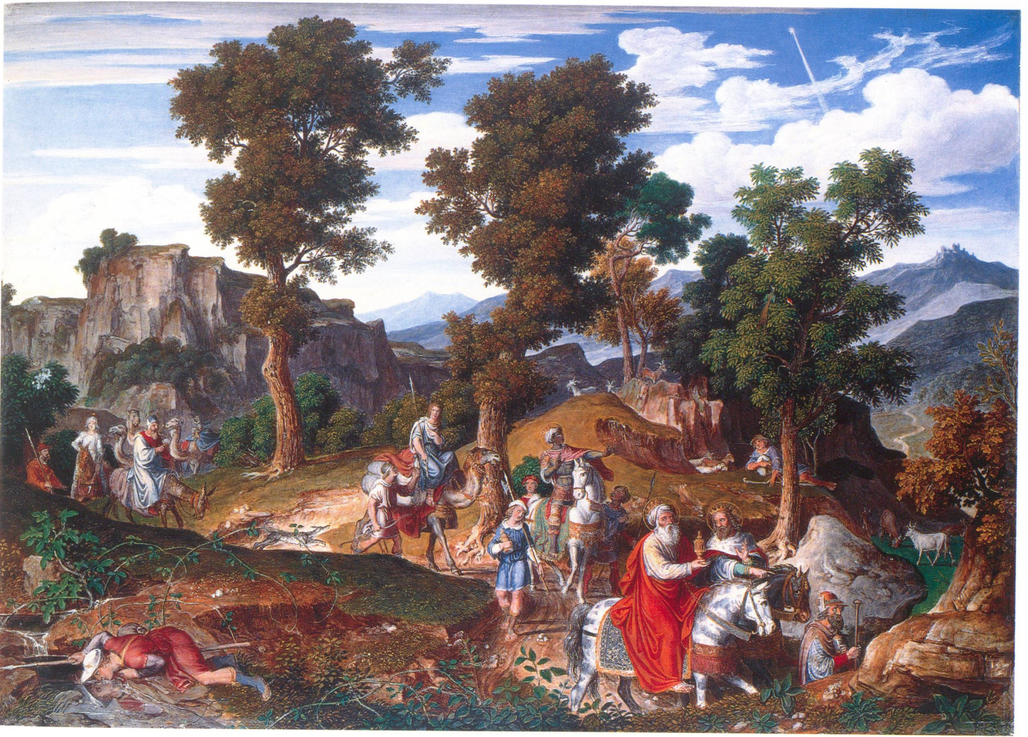
Joseph Anton Koch (1768–1839), Serpentara-Landschaft mit dem Zug der Heiligen Drei Könige, Kunstmuseum Düsseldorf im Ehrenhof.

Weil Sie die Legende jetzt öffentlich zur Sprache gebracht und doch selbst nicht weiter Hand anlegen wollen, so fürchtete ich, die Sprach- und Deutungswuth möchte darüber kommen, und desshalb glaubte ich, da ich einmal in die Sache hineingezogen bin und die deutsche Handschrift aufgefunden habe, gleich etwas thun zu müssen, um einem solchen Beginnen vorzubauen.