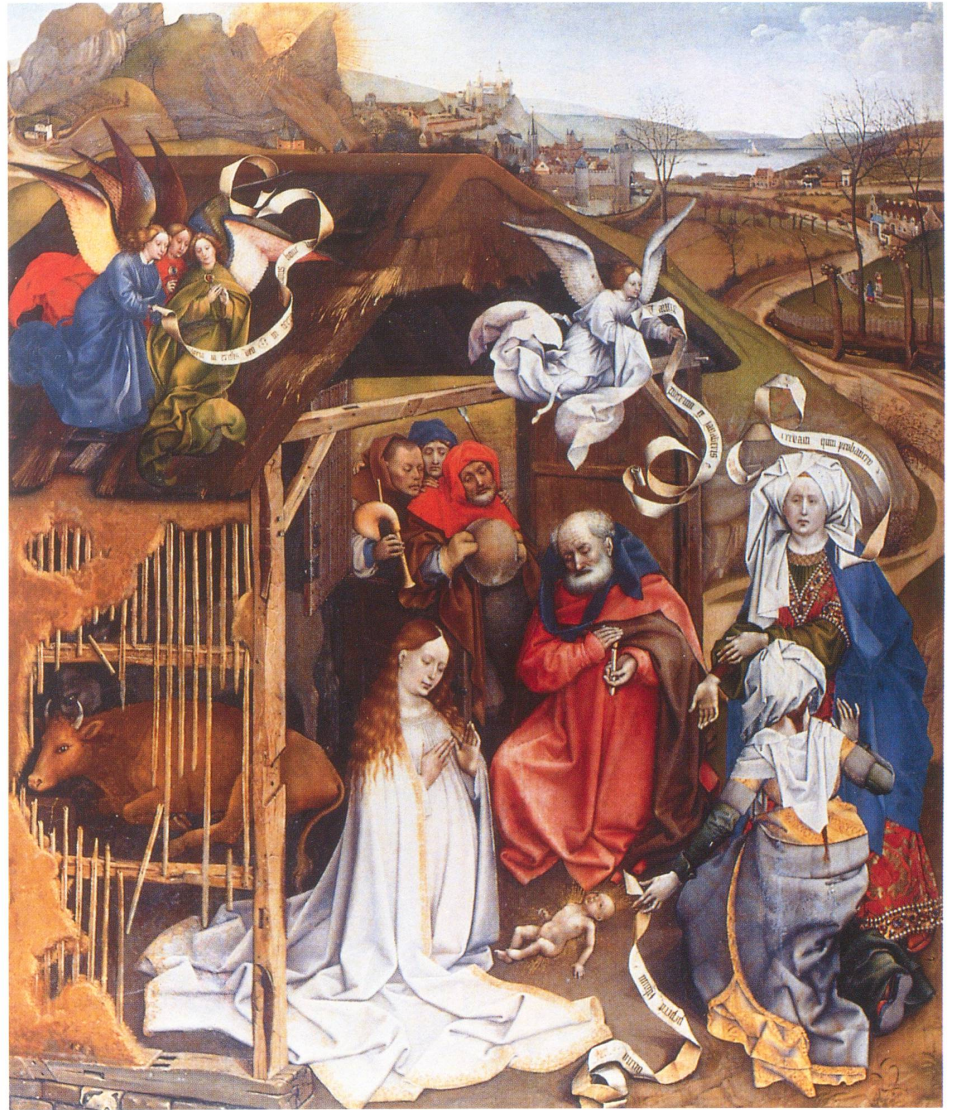
Robert Campin, gen. le Maître de Flémalle (1378/79–1444), Die Anbetung der Hirten, Musée des Beaux Arts, Dijon.

In jener Gegend hielten Hirten auf freiem Felde Nachtwache bei ihrer Herde. Da trat ein Engel des Herrn zu ihnen, und die Herrlichkeit des Herrn umstrahlte sie. Und sie fürchteten sich sehr. Der Engel aber sprach zu ihnen: «Fürchtet euch nicht! Seht, ich verkünde euch eine grosse Freude, die allem Volke zuteil werden soll: Heute ist euch in der Stadt Davids der Heiland geboren, der Messias und Herr. Und dies soll euch zum Zeichen sein: Ihr werdet ein Kind finden, das in Windeln gewickelt ist und in einer Krippe liegt.»