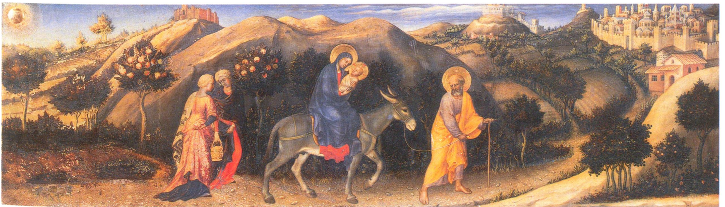
Gentile da Fabriano (vor 1370–1427), Die Flucht nach Ägypten, Uffizien, Florenz