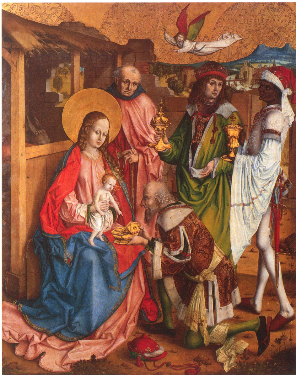
Nelkenmeister, Die Anbetung der Heiligen Drei Könige, Franziskaner Kirche, Freiburg i. Üe.

Vor diesem Hintergrund sind die Arbeiten Gu-