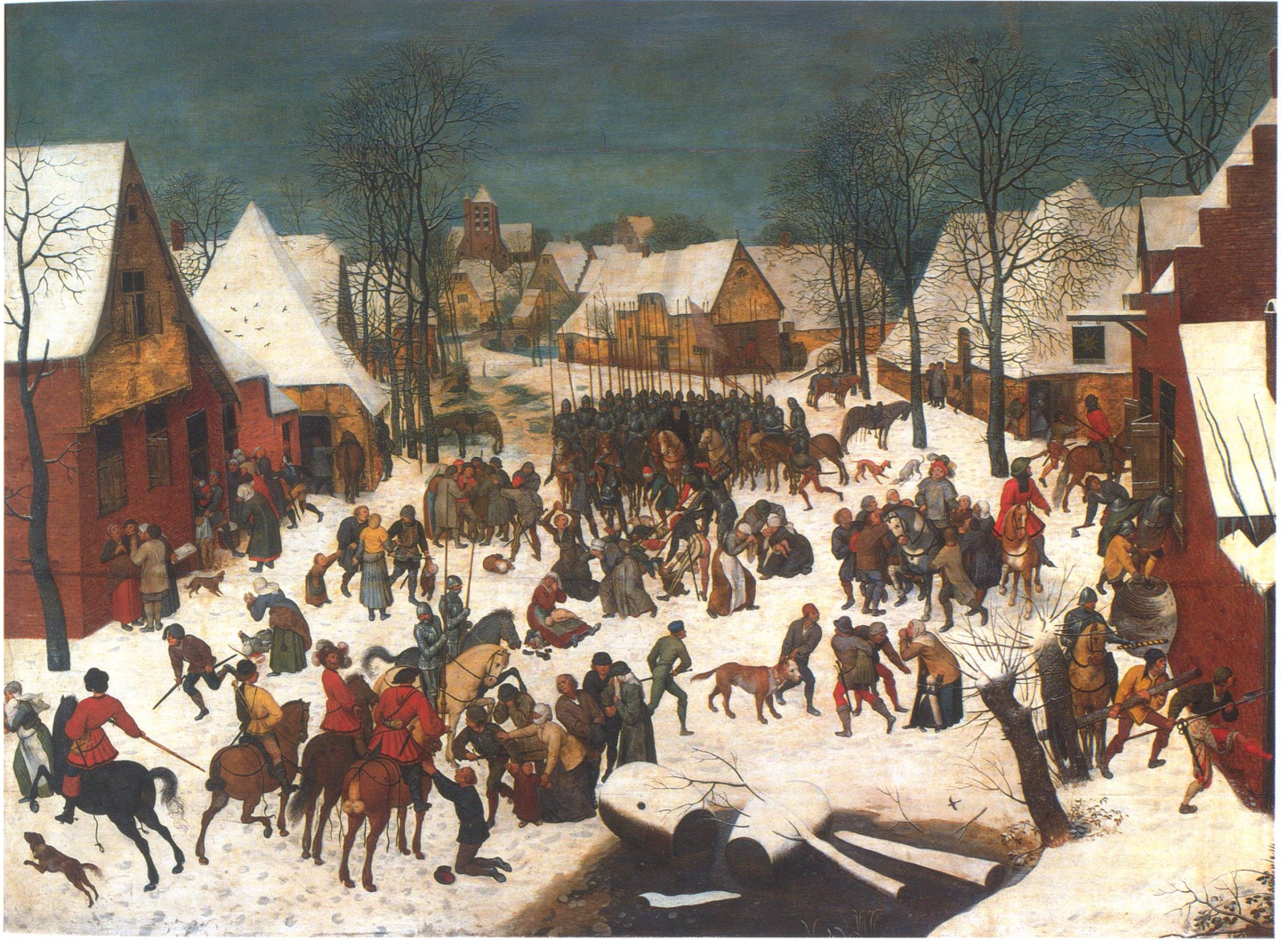
Pieter Bruegel d. Ä. (1527/28–1569), Der Kindermord von Bethlehem, Kunsthistorisches Museum, Wien.

Als Herodes sich von den Weisen hintergangen sah, geriet er in heftigen Zorn. Er liess in Bethlehem und in dessen ganzem Gebiete alle Knäblein von zwei Jahren und darunter umbringen – entsprechend der Zeit, die er von den Weisen erforscht hatte. Da erfüllte sich das Wort des Propheten Jeremias, der da spricht: