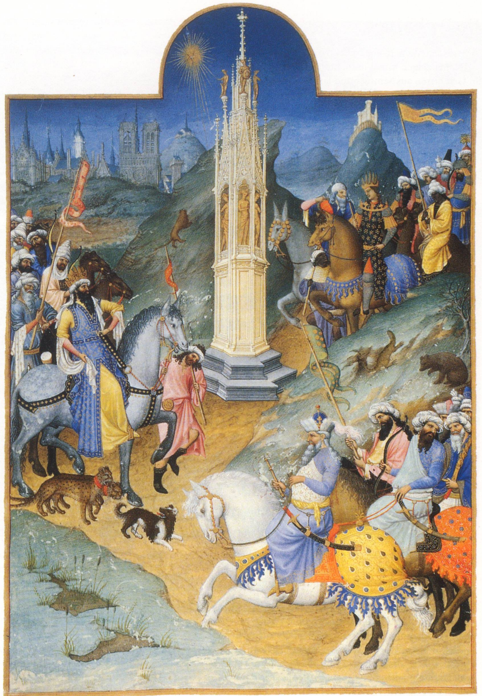
Paul von Limburg, Die Begegnung der Heiligen Drei Könige (aus: Les Très Riches Heures des Jean, Duc de Berry, um 1413 bis 1416), Musée Condé, Chantilly

«Wegen der Dreikönigslegende habe ich auf Ihre letzte Erklärung eine Abrede mit dem hiesigen jungen Dichter, Gustav Schwab, getroffen; dieser, ein sehr verständiger, einsichtsvoller Mann, ist bereits beschäftigt, von dem deutschen Manuscript, welches das badische Ministerium mir nur auf drei Monate hat senden lassen, eine Abschrift zu besorgen. Wenn diese vollendet ist, wünschen wir, sie mit Ihrem lateinischen Original zu vergleichen, worauf dann die Redaktion, wir glauben am besten in Luthers Bibelsprache, vorgenommen und alles weitschweifige und unbehagliche weggeschnitten werden soll. Sind Sie mit diesem Plan zufrieden, so haben Sie die Güte, mir Ihr Manuscript mitzuthemen, Sie werden dasselbe gleich nach dem Gebrauch zurückerhalten, und wir werden Ihnen dann später die Bearbeitung zur gütigen Durchsicht und Beurtheilung vorlegen.