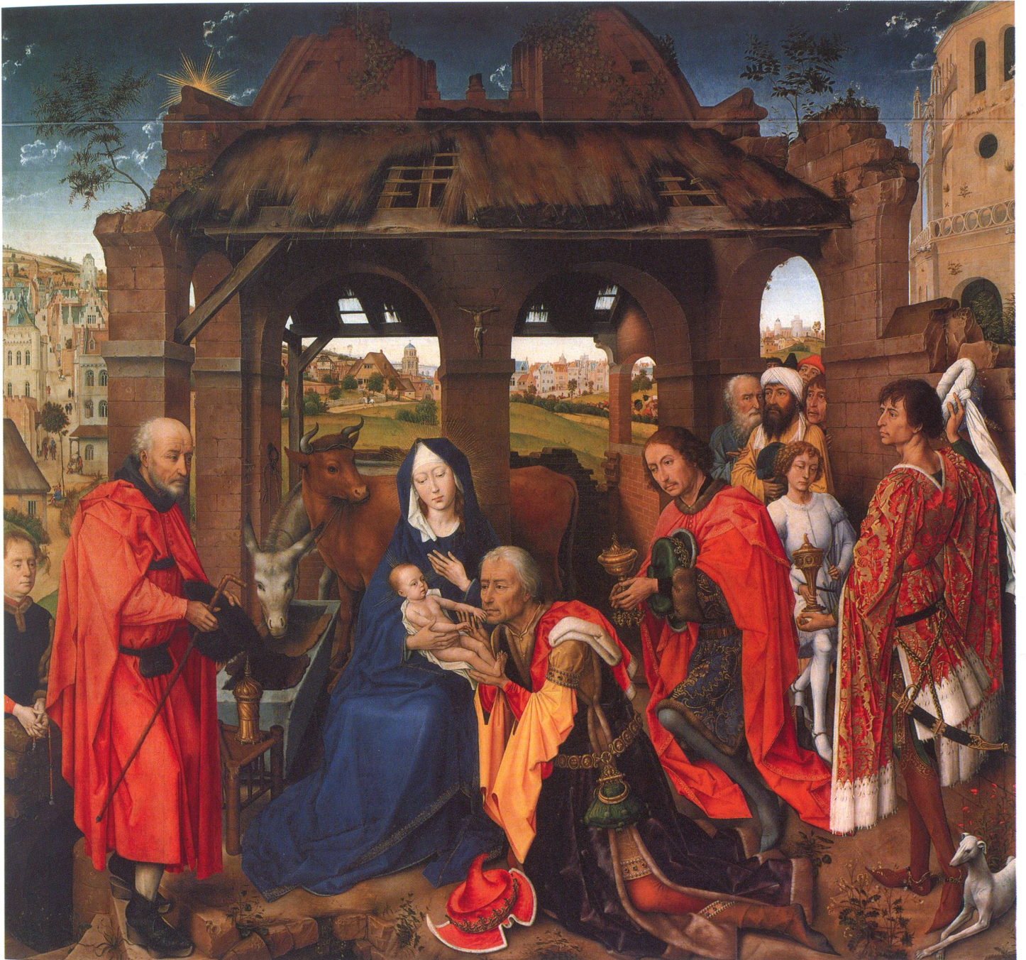
Rogier van der Weyden (um 1400–1464), Die Anbetung der Heiligen drei Könige, Bayerische Staatsgemäldesammlungen – Alte Pinakothek, München, Foto: Artothek, Kunstidia-Archiv Jürgen Hinrichs, Peissenberg.