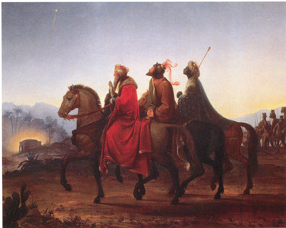
Leopold Kupelwieser (1796–1862), Der Zug der Heiligen Drei Könige, Österreichische Galerie, Wien