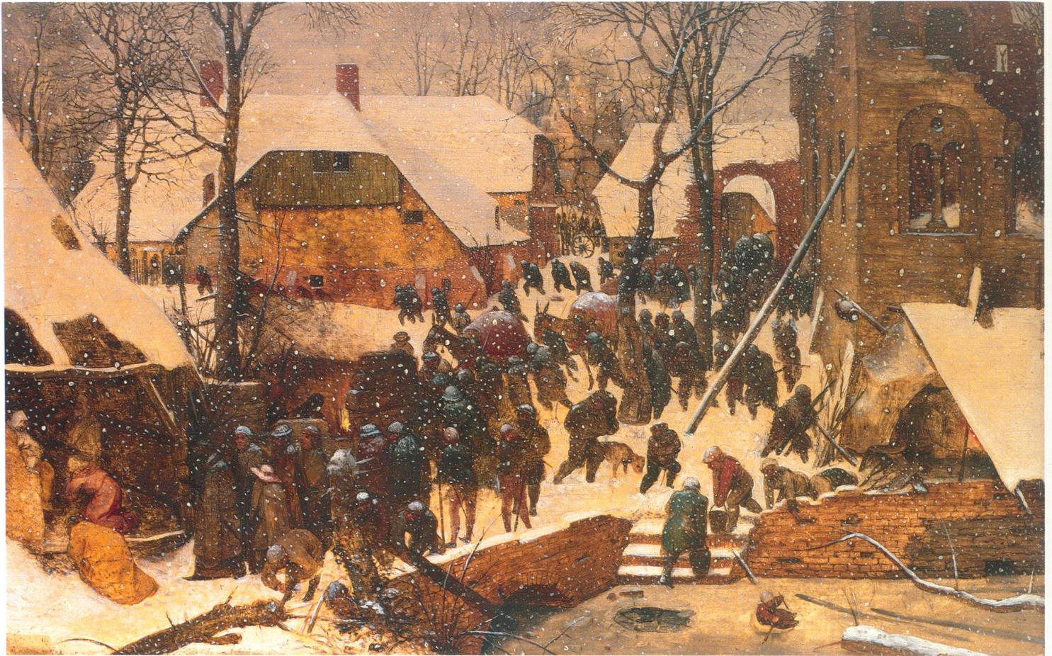
Pieter Bruegel d. Ä. (1527/28–1569), Die Anbetung der Könige im Schnee, Sammlung Oskar Reinhart, Winterthur.

Darüber hinaus aber wird er dem Werk Johannes von Hildesheims durchaus gerecht und würdigt dasselbe umsichtig.