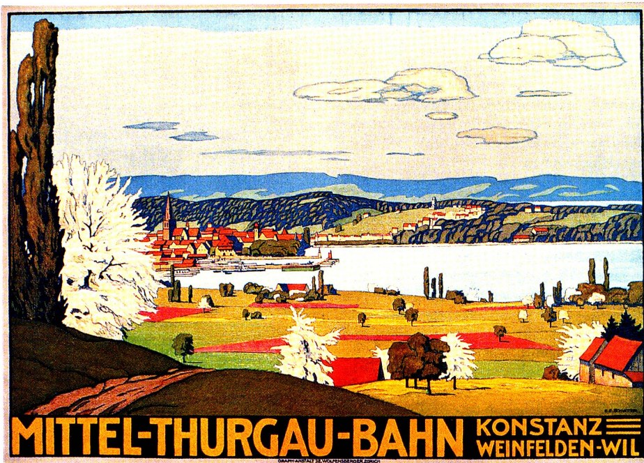
Mittel-Thurgau-Bahn Konstanz–Weinfelden–Wil. Ernst Emil Schlatter, 1912, Farblithographie, 76 × 107,5 cm. Stadtarchiv Konstanz; Museum für Gestaltung Zürich; Gewerbemuseum Basel.