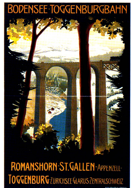
Bodensee-Toggenburgbahn. Anonym, 1912, Farblithographie, 140 × 97,5 cm. Gewerbemuseum Basel; Museum für Gestaltung Zürich.