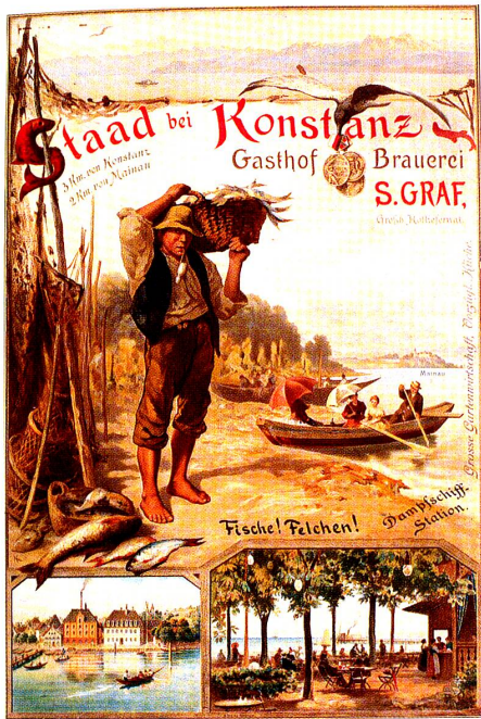
Staad bei Konstanz, Gasthof, Brauerei S. Graf. Anonym bzw. unbekanntes Monogramm A.K., um 1900, Chromolithographie, 62 × 42 cm. Hotel Schiff, Staad bei Konstanz.