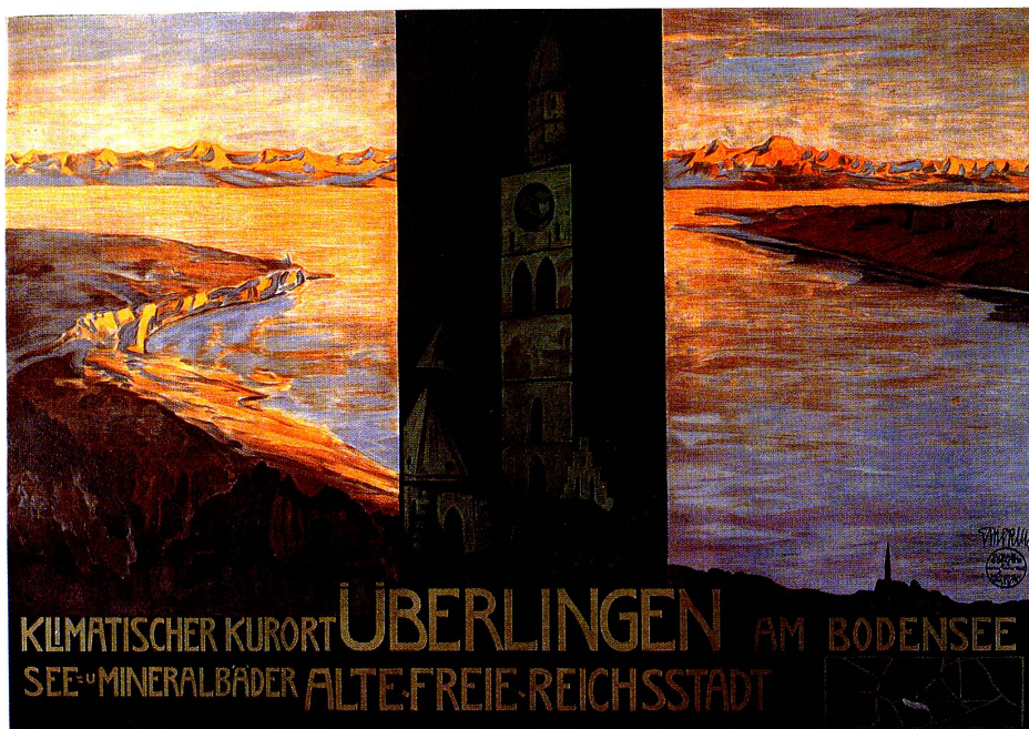
Klimatischer Kurort Überlingen. Ernst Emerich, um 1918, Farblithographie, 88 × 63 cm. Stadtarchiv Überlingen.

Im Lithographieplakat setzte sich die photographische Reproduktion erst spät durch. Zwar hatte man ab 1887 mit dem Verfahren des Photochromdrucks bei Orell Füssli in Zürich die Möglichkeit, direkt auf Stein zu belichten, doch dieser musste vor dem Druck noch stark retuschiert und überarbeitet werden. Da die Objekte noch keine ausreichende Tiefenschärfe erreichten, wurde die Photographie mit der Zeichnung kombiniert. Vor allem Hintergründe oder Personen, Schiffe oder ähnliches, die den Vordergrund beleben sollten, wurden von Hand eingezeichnet.