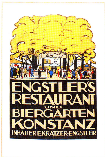
Engstler's Restaurant und Biergarten, Konstanz. Otto Baumberger, 1912, Farblithographie, 100 × 70 cm. Museum für Gestaltung (MfG) Zürich; Gewerbemuseum Basel.

bildhaft strukturiert. Das Schriftfeld greift die Farben aus dem Bildfeld auf, das helle Braun des Bodens setzt sich in der Schrift fort, so dass ein Umkehrreffekt entsteht: Die dunkelbraune Fläche kann nicht nur als unterlegte gesehen werden, sondern ebenso als aufgelegte, ausgeschnittene Schrift-Schablone. Durch Farbgebung und achsensymmetrische Komposition verbinden sich Bild- und Textgestaltung zu einer Einheit. Genau über dem Schnittpunkt von Mittelhorizontaler und -vertikaler liegt der Eingang zum Biergarten. Baumberger belebt ihn mit einer bunten Menge von Besuchern in allen Variationen: grosse, kleine, dicke, dünne, junge, alte, sogar eine Familie mit Kinderswagen, alles strebt dem Eingang zu. Die Aufforderung ist unverkennbar!