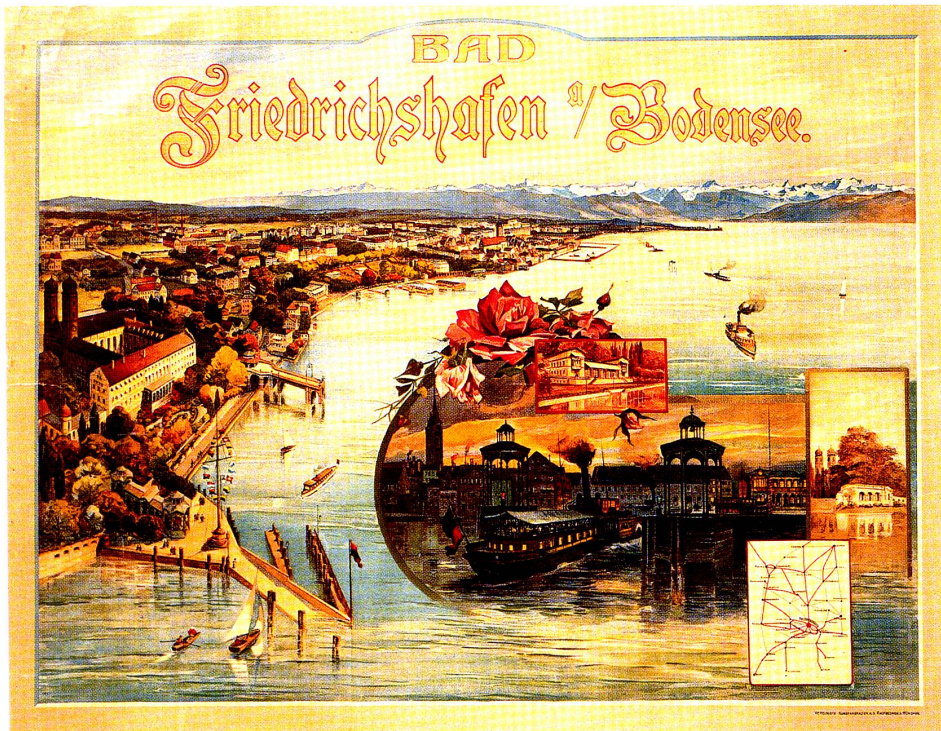
Bad Friedrichshafen. Anonym, um 1900, Chromolithographie, 89 × 113,5 cm. Stadtarchiv Friedrichshafen.