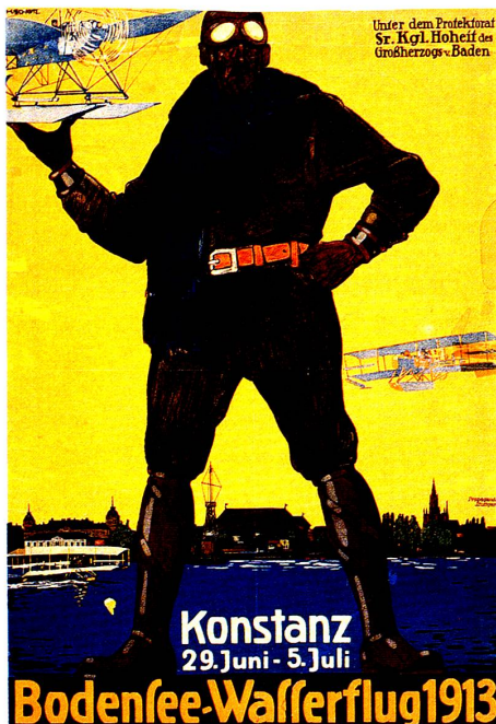
Konstanz Bodensee-Wasserflug, 1913. H. Schütz, 1913, Farblithographie, 97 × 69,5 cm. Plakatsammlung Stadtmuseum München; Verkehrshaus Luzern; Museum für Gestaltung Zürich.

Dies mag daran liegen, dass das Plakat als Teil einer immer perfekteren Organisation der Frem-