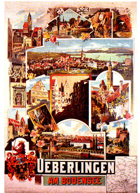
Überlingen am Bodensee. Anton Reckziegel, vor 1900, 90,5 × 61,5 cm, Stadtarchiv Überlingen.