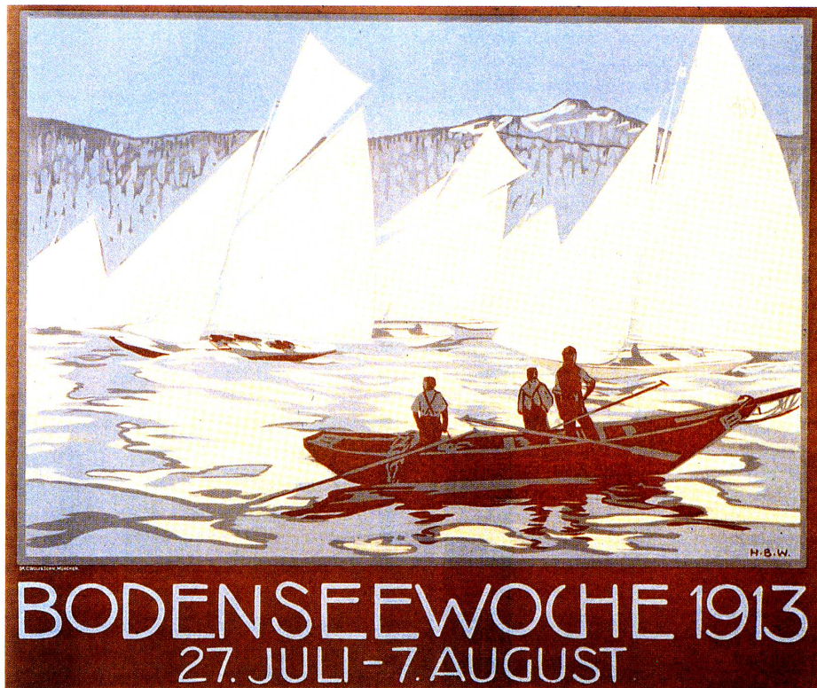
Bodenseewoche 1913. Hans Beat Wieland, 1913, Farblithographie, 82 × 97 cm. Museum für Gestaltung Zürich.

Der Kontrast von Licht und Schatten macht aber gerade seinen künstlerischen Reiz aus. Das Werk des Bildnis- und Landschaftsmalers Erwin Emerich steht in der Tradition der Künstlerplaka-