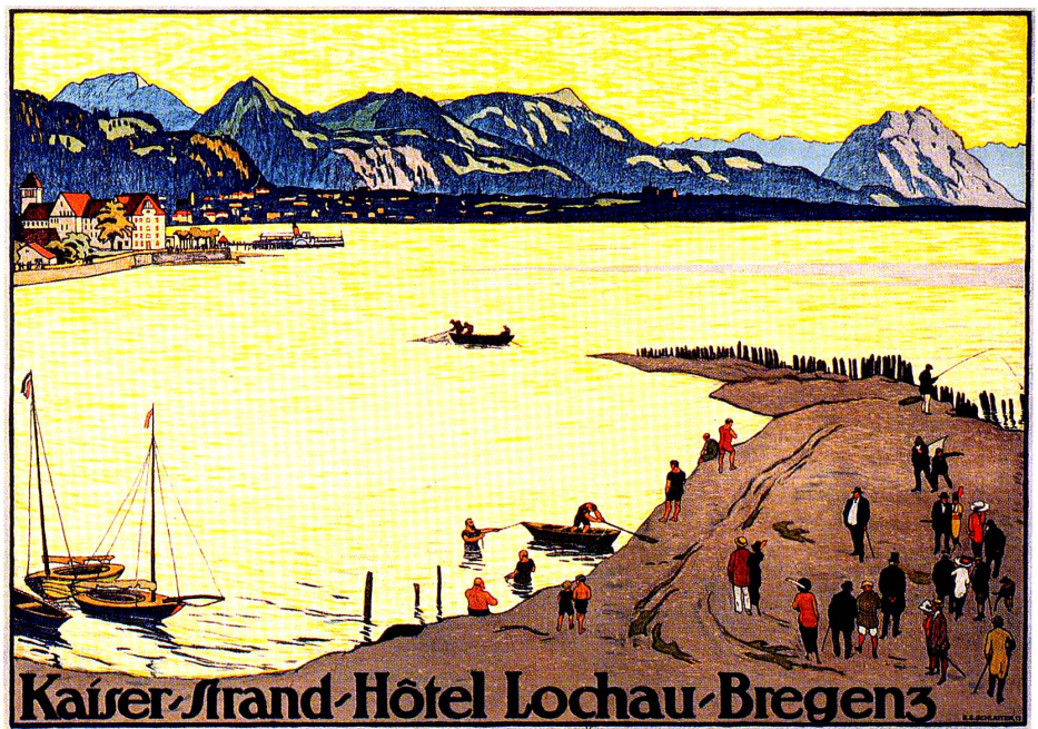
Kaiser-Strand-Hotel, Lochau-Bregenz. Ernst Emil Schlatter, 1913, E.E. Schlatter 13, Farblithographie, 74 × 104 cm. Gewerbemuseum Basel/MfG, Plakatsammlung.

Das Hotel, der eigentliche Gegenstand der Werbung, ist klein in den Hintergrund gerückt. Deutlich aber wird seine idyllische Lage, und deutlich werden vor allem die vielen Erlebnis-möglichkeiten, die ein Aufenthalt dort bietet.