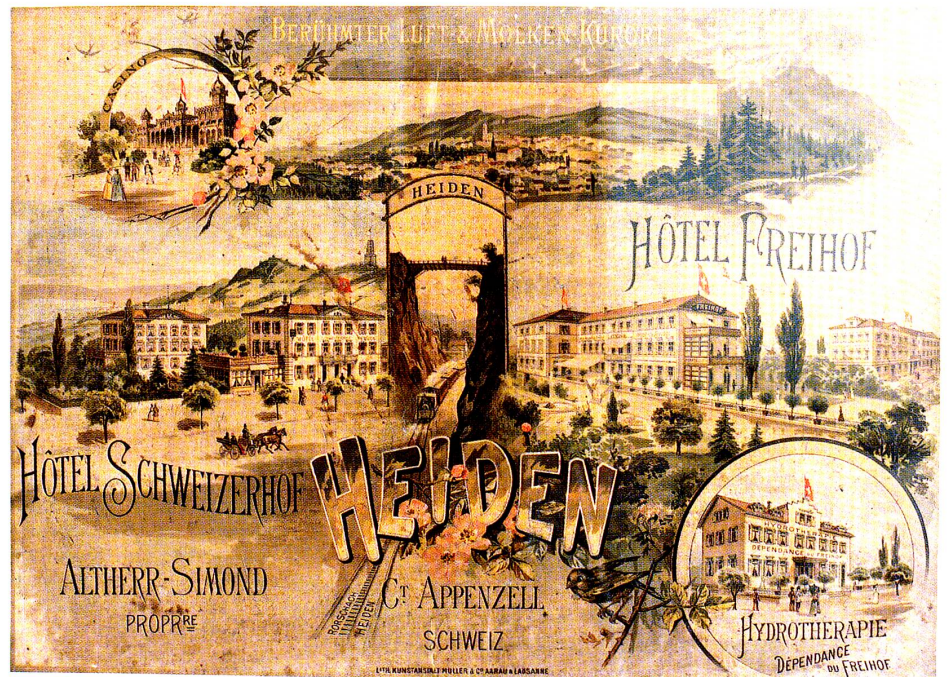
Hotel Freihof Hotel Schweizerhof, Heiden. Anonym, um 1890, Farblithographie, 64 × 90 cm. Ortsmuseum Heiden.