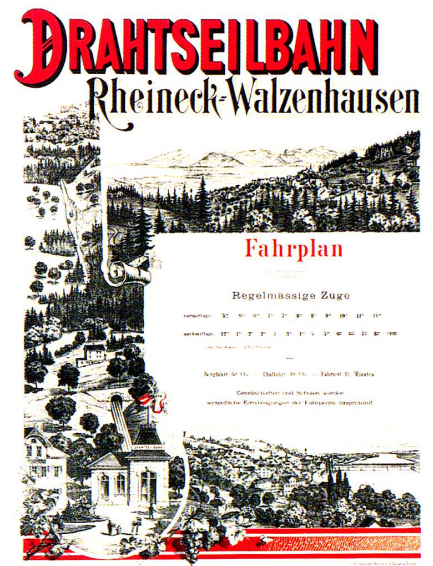
Drahtseilbahn Rheineck–Walzenhausen, Fahrplan. Anonym, nach 1896, Lithographie, zweifarbige (rot und braun), 66 × 51 cm. Museum für Gestaltung Zürich.

Das Plakat eines anonymen Gestalters von 1912, Bodensee-Toggenburgbahn , ist Teil einer Serie für Schweizer Bahnen. Es stellt in kräftigen Grünabstufungen einen Ausschnitt der Landschaft dar, die durch die neue Bahnlinie erschlossen wird. Die Landschaft wird ins subjektive Blickfeld des Betrachters gerückt. Rahmende Büsche, Blätter und Bäume vermitteln den Eindruck eines Gesichtsfeldes und definieren den Standpunkt des Betrachters. Er blickt selbst auf die Landschaft und