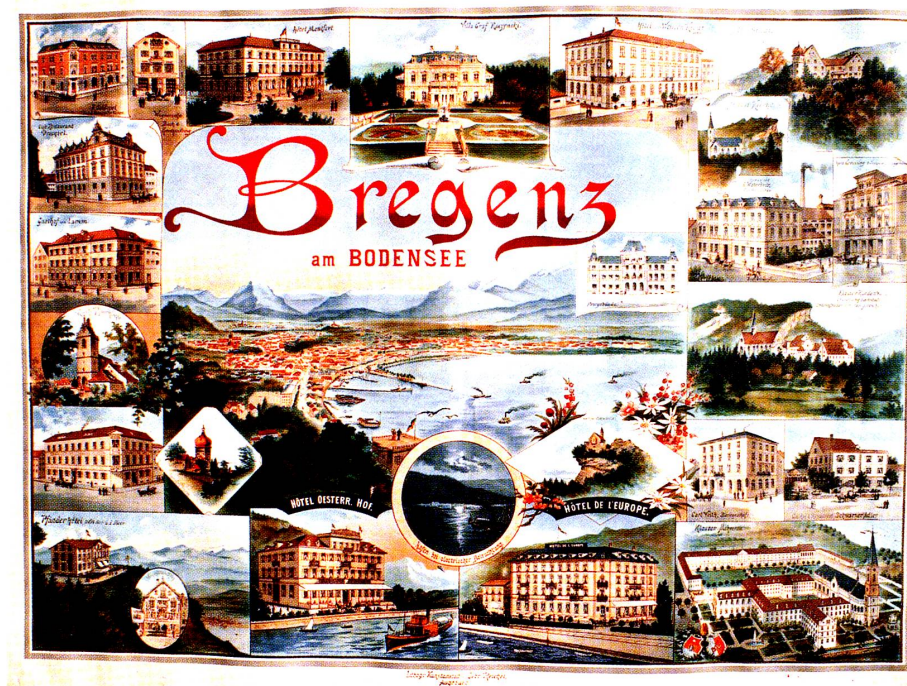
Bregenz am Bodensee. Anonym, 1893, Chromolithographie, 80 × 107 cm.

wird in sie hineinversetzt. Nicht aus der Situation des Reisenden sieht er sie, sondern von einer Anhöhe geht der Blick hinunter ins Flusstal und hinauf zum talüberspannenden Eisenbahnviadukt (ein beliebtes, immer wiederkehrendes Motiv in Schweizer Plakaten). Durch seine überhöhte Darstellung wird die technische Leistung hervorgehoben, die in der Öffentlichkeit grosse Anerkennung fand. Die Doppelung der senkrechten und gebogenen Silhouettenformen in den Bäumen und der Talbrücke gleicht die natürlichen und architektonischen Elemente einander an. Natur und Ingenieurleistung werden in Bezug gesetzt. Die Bahn selbst wird nur klein im Mittelgrund dargestellt.