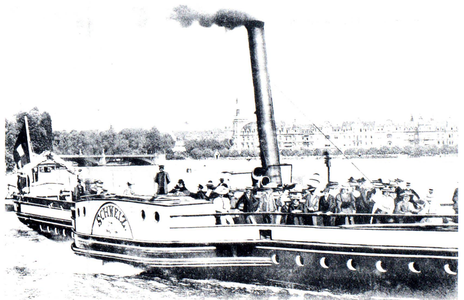
Reisegesellschaft auf einem Untersee-Dampfschiff vor dem Konstanzer Stadtgarten.

Die Unterhaltung, neben Natur und Kultur das dritte Angebot, bestand in dieser Entwicklungsphase fast ausschliesslich aus Konzerten. Für diesen Zweck wurde 1886 der Stadtgarten mit einem Musikpavillon gekrönt und erhielt damit einen mondän-kurmässigen Charakter. Zum ersten Mal tauchten in dieser Zeit auch Forderungen nach einem Kurhaus auf. Als Standort hatte man den Stadtgarten im Auge. Man wollte den Gondelhafen auffüllen und darauf das Kurhaus mit Konzert-, Lese-, Spiel- und Restaurationsräumen errichten (1889). Um direkt mit dem Publikum in Verbindung treten und Auskünfte erteilen zu können, ging der Kur- und Verkehrsverein über seine organisatorisch-vorbereitende und werbende Tätigkeit hinaus und eröffnete 1889 ein eigenes Verkehrsbüro, das ab 1892 in der Buchhandlung Ackermann publikumsnah untergebracht war.