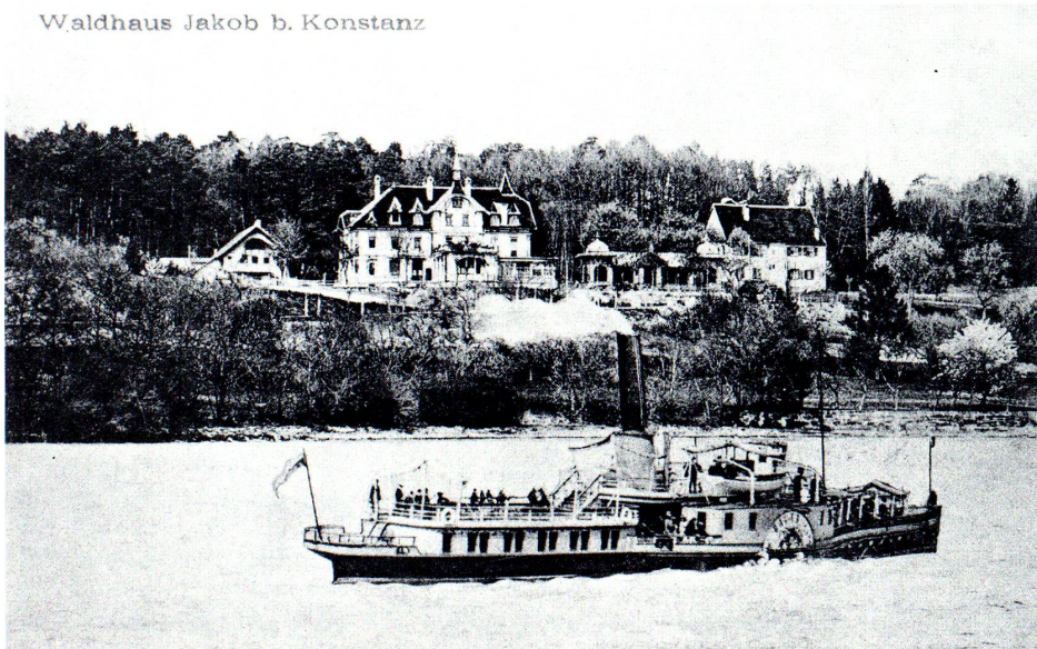
Waldhaus Jakob b. Konstanz

Waldhaus Jakob, Neubau nach einem Brand 1897 eröffnet.